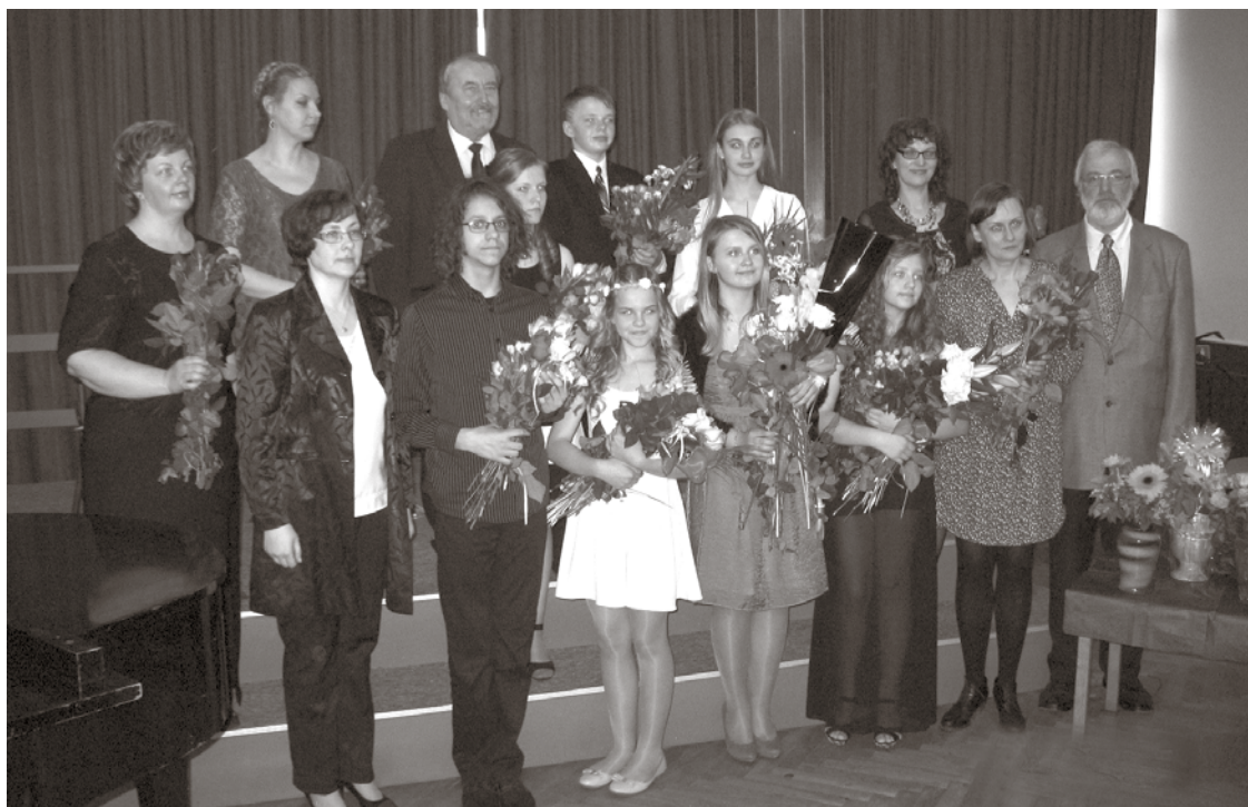
Absolventu un skolotāju kopbilde.