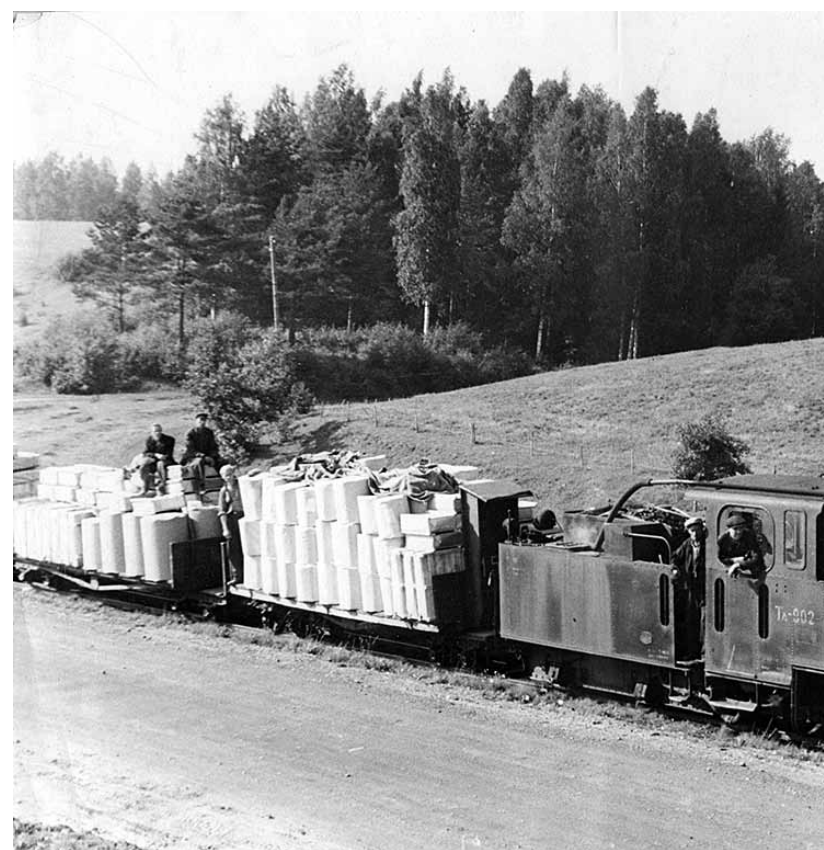
No Leonarda Volgina ģimenes arhīva – fabrikas bānītis. Foto: dāvin

No izstādes „Stūra mājā” – komunisma cēlāju morāles kodeksa tikumiskie principi. Foto: Kaspars Krafts