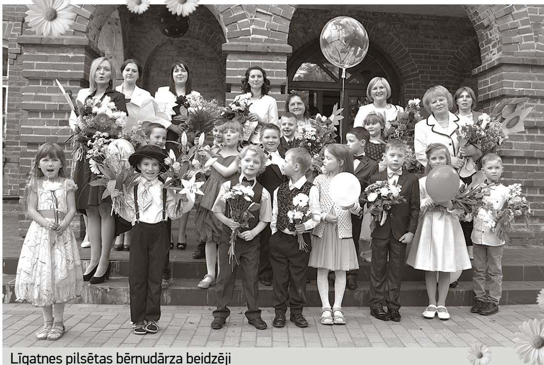
Līgatnes pilsētas bērnudārza beidzēji

Ko es gribēju tev šodien līdzī dot: Sava laime katram pašam jāatrod, Savi draugi katram pašam jāsatiek, Katram pašam jāsasalst un jāapsniedz, Katram pašam marta saulē jāatkūst Un kā ābelei no augļu svara jānolūst. Katram pašam jārūgst līdzī raugam – Tikai tā par cilvēkiem mēs augam. /Imants Ziedonis/