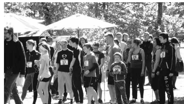
Aizvadīts pirmais „Līgatnes skrējienis 2015”

23. maijā tikai aizvadīts pirmais „Līgatnes skrējienis 2015”. Dalībnieku pulkā bija gan profesionāli sportisti, gan tie, kas vēlējas sportiski pavadīt novada svētkus. Sacensības notika trijās distancēs. 700 metru skrējienis bērniem, 4,5 km