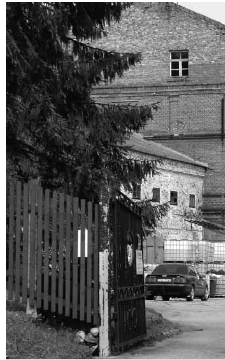
Papīrfabrikas vārti vērušies svētku

Papīra svētkos veicām arī līgatniešu skaitīšanu. Kopā svētku laikā līgatniešu sarakstā reģistrējās 324 cilvēki. No tiem 185 bija jaunākas un vecākas dāmas un 139 visu vecumu kungi. 93 cilvēki norādīja, ka ir dzimuši Līgatnē. Saskaitot fabrikā nostrādāto gadu skaitu, kopā svētku dalībnieki Līgatnes papīrfabrikā nostrādājuši 1791 gadu. Dažiem tie