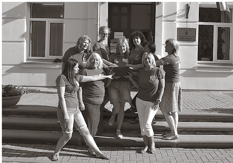
Nometnes pedagogi pie Līgatnes novada vidusskolas

nātkāru un dzīvespriecīgu jauniešu vecumā no 12 līdz 14 gadiem savos atmiņu kamberos mēģina atrast jau labi aizmirstas lietas, mācās ko jaunu, lasa seno latviešu druku, dzejo, sērfo internetā, tuvāk iepazīst britu slavenības, sportistus. Pie samovara (patvāra), dzerot čaju (tēju) no tasītēm, iepazīst krievu tautas