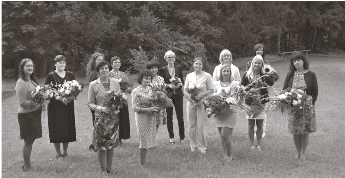
Līgatnes vidusskolas pilsētas ēkas skolotāju kolektīvs 2014. gada 1. septembrī.