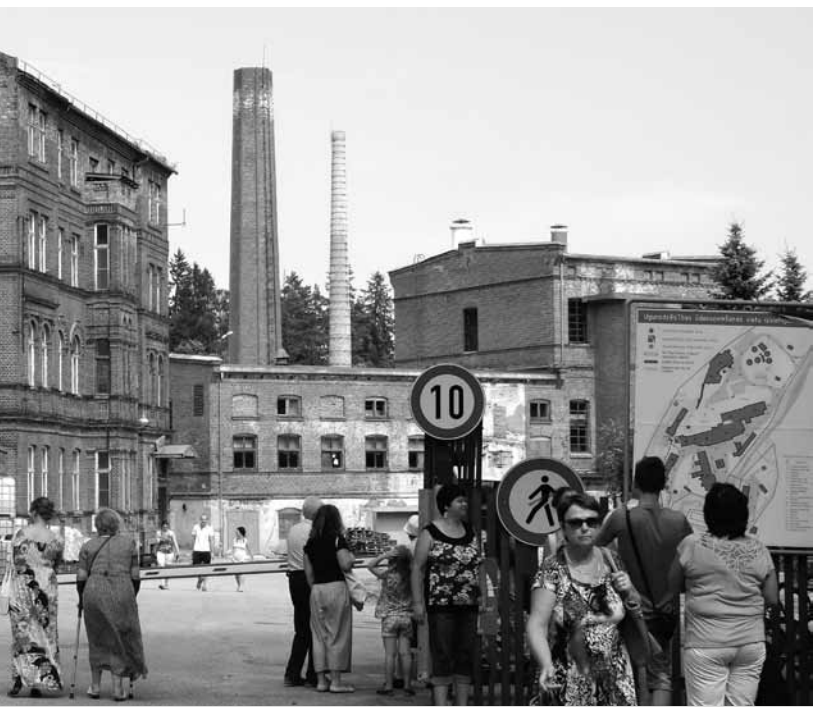
u dalībniekiem.

fabrikas jubilejas svinībām, kā arī autors idejai par piemiņas akmeni un tajā ielikto kapsulu ar fabrikas hroniku.