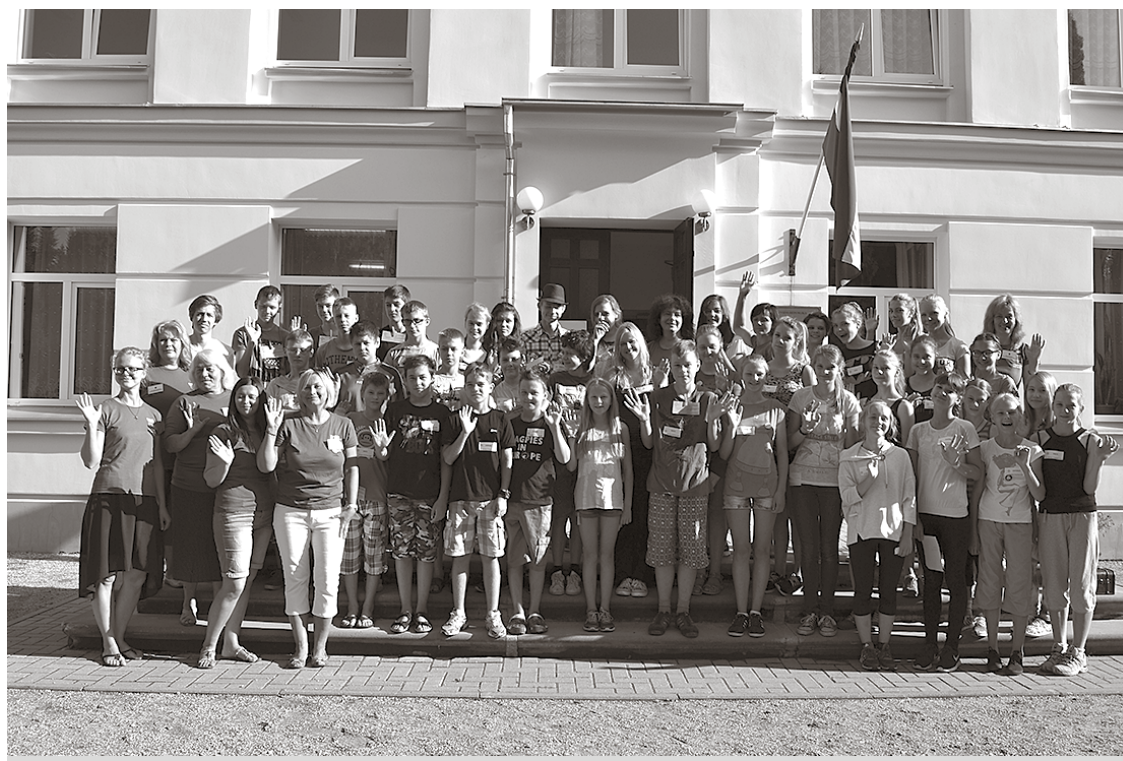
Nometnes dalībnieki pie Līgatnes novada vidusskolas

tradīcijas, simbolus, dziesmas. Iecerēts rīkot skaistuma konkursu matrjoškām (tradicionāla krievu rotaļlieta: no izdabta koka darinātas lellītes, kas ieliekamas cita citā) un iemācīties vienu no vecāku bērniības mīldziesmiņām „... es guļu saulītē...”. Un, protams, palēnām vien nometnes dalībnieki kāpj augšup pa