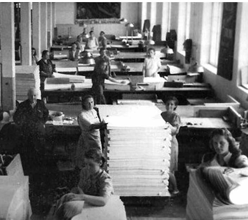
Sienas ceha skats 20. gs. 60. gados