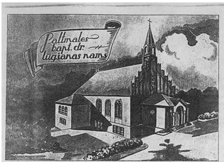
Paltmales baptistu draudzes lūgšanu nams