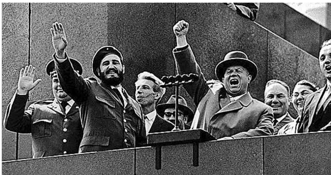
PSRS un Kubas draudzības mītiņš