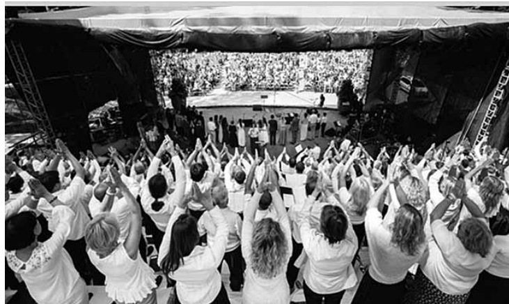
Ekumēniskais dievkalpojums Cēsīs