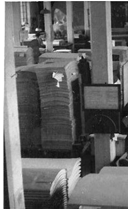
Līgatnes papīrfabrikas papīršķiroš

Atbilde pavisam vienkārša: tā bija civilās aizsardzības sistēmas sastāv-