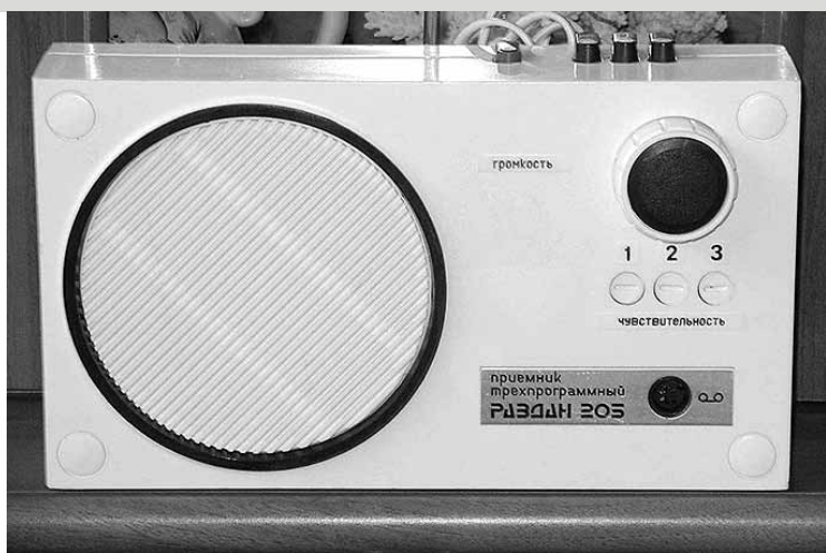
Radiotranslācijas reproduktors „Razdan 205”