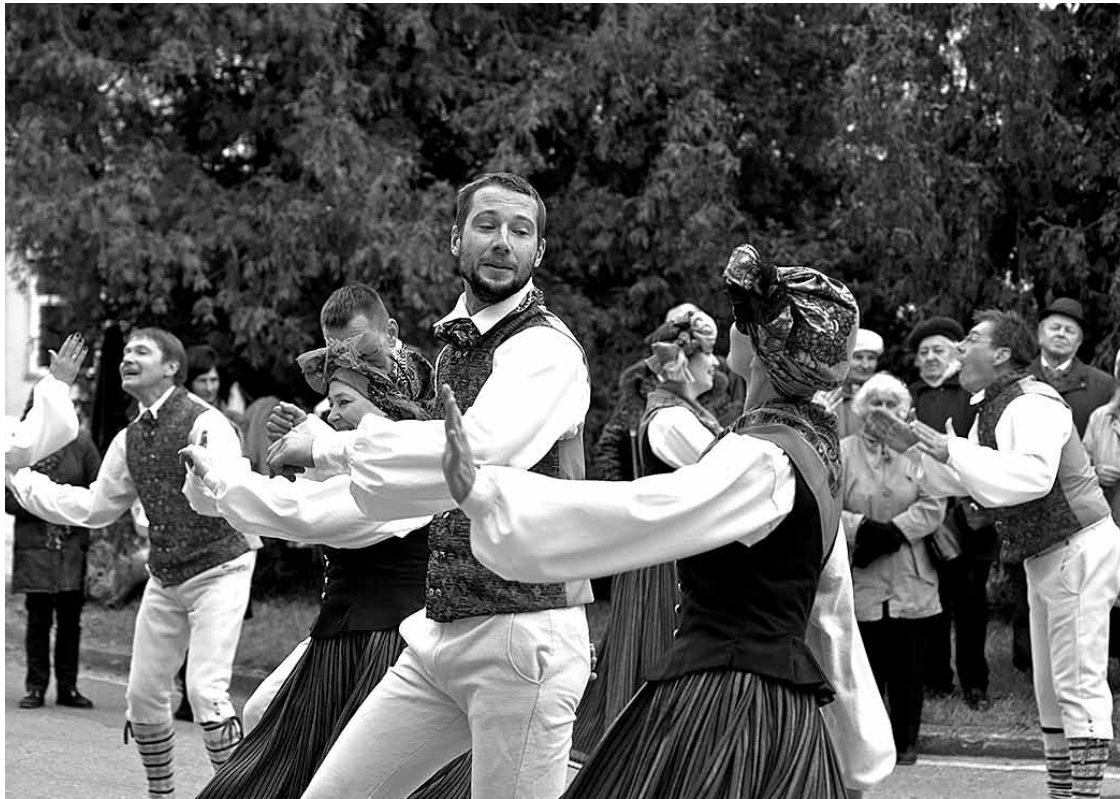
TDK „Zeperi” dejo Ražas svētkos.