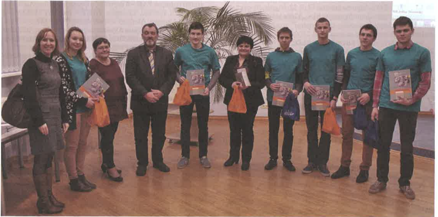
Aknīstes vidusskolas komandas uzvara novadu spēlēs.

Turpinājums 13. lpp.