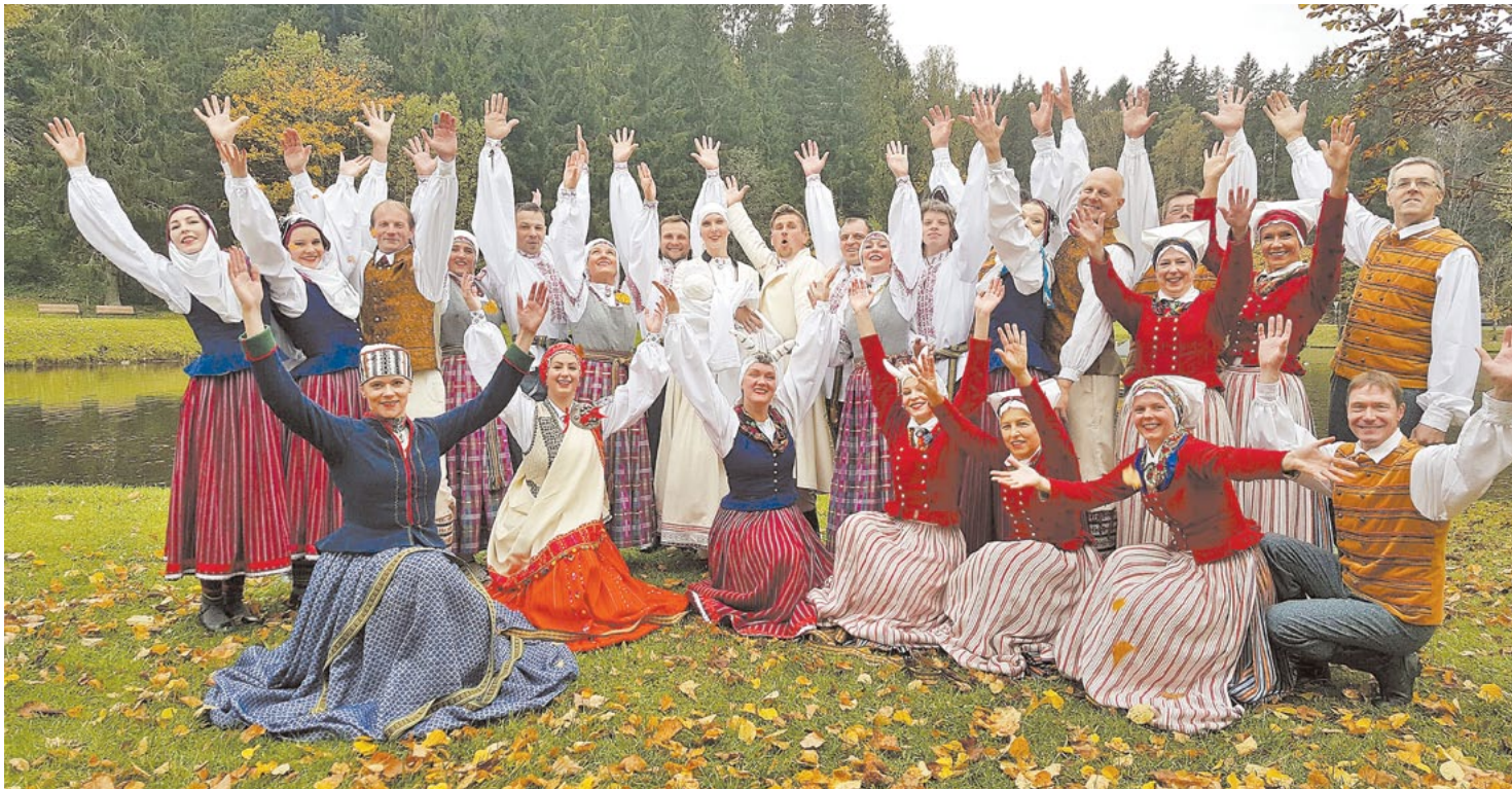
“Zeperi” pēc rudens ražas tirdziņa Līgatnē 9. oktobrī.

“Latviešiem ir sena esamības vēsture, bet īsa valstiskā vēsture. Bet šī īsā valstiskuma vēsture ir arī mūsu izdevība, jo tas nozīmē, ka mūsu vēsture ir kā balta lapa. Mēs varam tajā rakstīt, un mums ir iespējas to iespaidot. Tas dod tādu brīvību, kādas mūsu senčiem ilgu gadsimtu nebija. Un mēs nedrīkstam to aizmirst. (...) Valstiskā neatkarība paver citus apvāršņus. Tā sniedz iespēju attīstīt savu kultūru, saglabāt savu valodu, ko ir ļoti grūti saglabāt citos apstākļos. Tādēļ mēs nedrīkstam nicināt savu valstiskumu. Es domāju, ka mums ir jāmīl sava valsts tikpat ļoti,