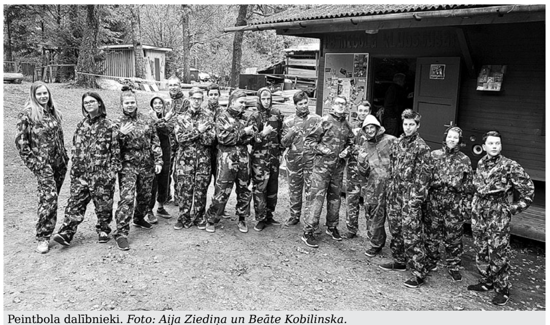
Peintbola dalībnieki.