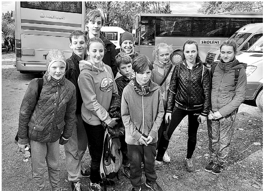
Līgatnes krosa dalībnieki.

Līgatnes novada vidusskolas sporta skolotāja