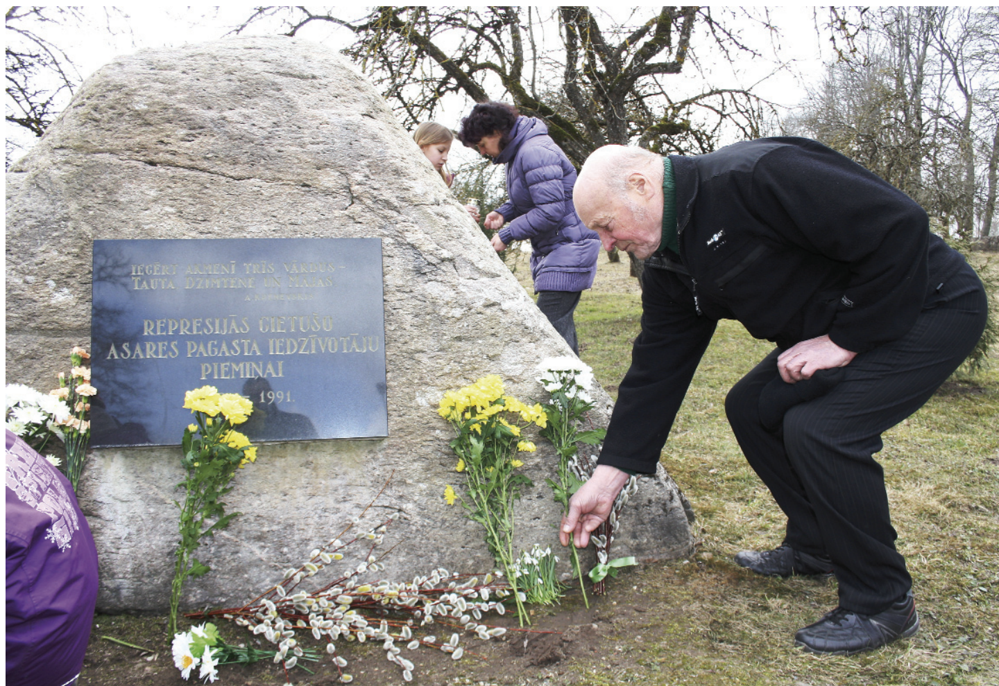
Represēto piemiņas pasākums . Lasīt — lpp