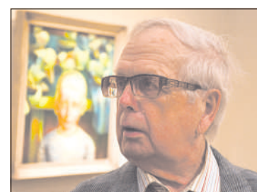
Фотограф Мечислав Цауне.

время, когда почти каждый художник пытался создать произведение искусства лучше, чем его коллега. «Я тоже старался идти в ногу со временем, но догнать его не удалось», — шутя признался Мечислав Цауне.