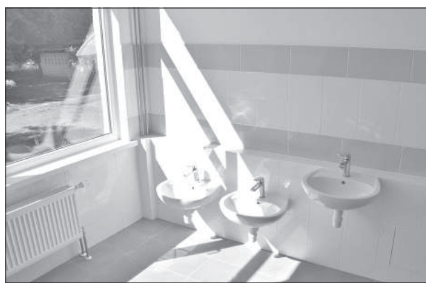
В рамках проекта были установлены новые умывальники.

чалась активная фаза проекта «Обновление помещений в дошкольном учреждении «Спридитис» в