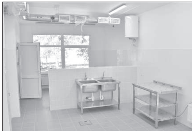
Обновлен кухонный блок.

Помещения на самом деле уже давно нуждались в ремонте. В итоге 25 октября 2021 года здесь на-