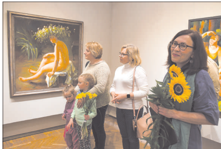
На открытии выставки.