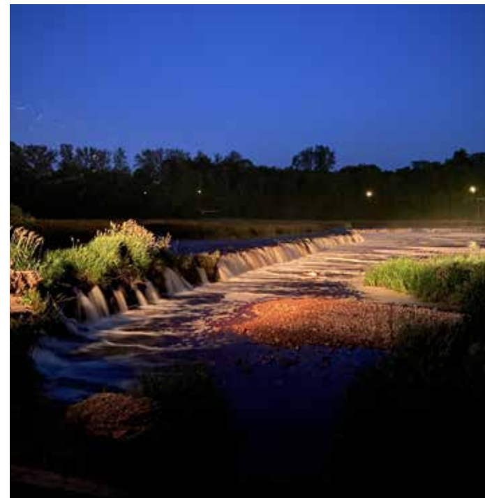
Ventas rumbas izgaismošana notikusi testa režīmā, bet būs konkrēts laiks, ko izziņos novada tūrisma attīstības centrs, kad to atkal varēs redzēt.

Vairāki iedzīvotāji bija pamanījuši, ka kādu nakti Ventas rumba bijusi skaisti izgaismota, bet pārējās naktis vairs ne. „Kādēļ tā?“, viņi vaicā.