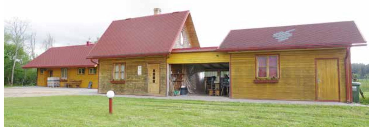
Līdzās vīnogu laukam ir ēka degustācijām un viesu uzņemšanai, blakus – vīna ražotne un pagrabs.