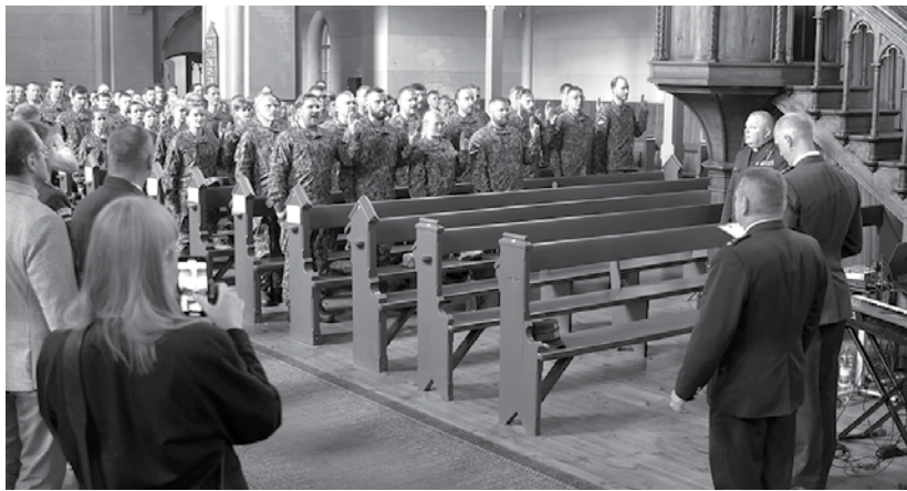
4. Kurzemes brigādi papildina 87 zemessargi.

87 jaunie zemessargi Kuldīgas Sv. Annas baznīcā zvērestu nodeva 30. jūnijā, kad 4. Kurzemes brigāde ar svinīgiem pasākumiem Kuldīgā un Skrundā sagaidīja Zemessardzes 30. gadadienu.