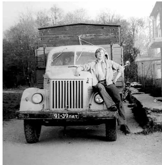
Lejaskurzemē uz paša samontēta auto – iesākumā bija rāmis. 1970. gads.