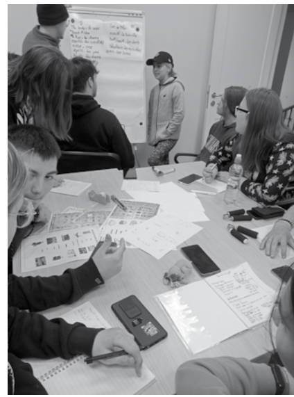
Franču jaunieši Latvijas bērniem māca franču valodu.