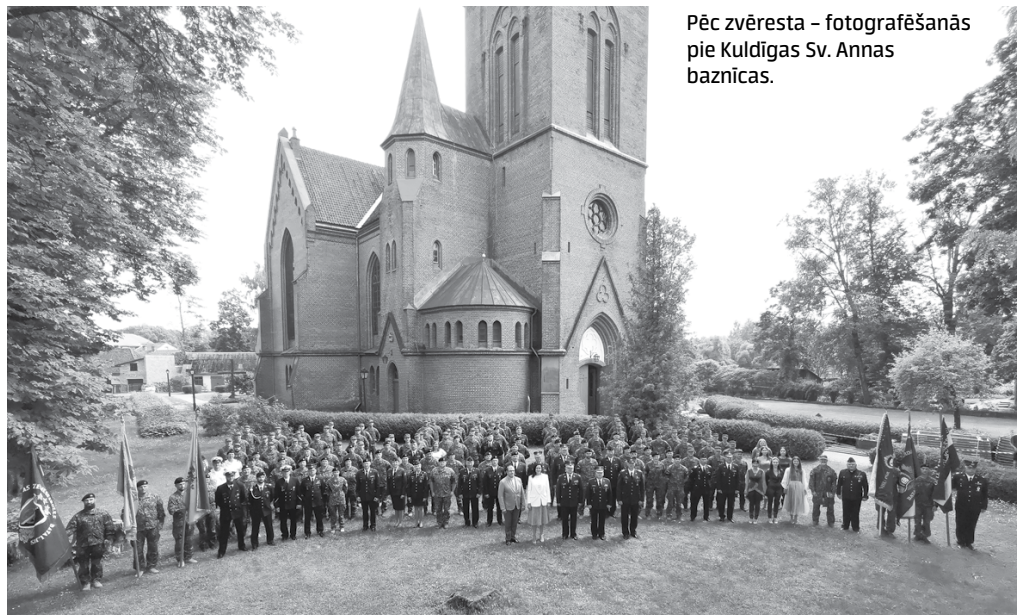
Pēc zvēresta – fotografēšanās pie Kuldīgas Sv. Annas baznīcas.