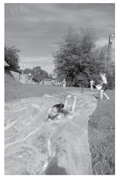
Bērnu un jauniešu priekam nevajag daudz – tikai plēvi, ūdeni, putas un vasaru.

Viesiem interesanta pieredze bija arī došanās uz Vaiņodi, kur uzturas bēgļi no Ukrainas. Tur gan bija liela valodas barjera, jo reti kurš no ukraiņiem runāja angļu valodā. Tur tika saprasts, ka krievu valodas zināšanas tomēr ir svarīgas.