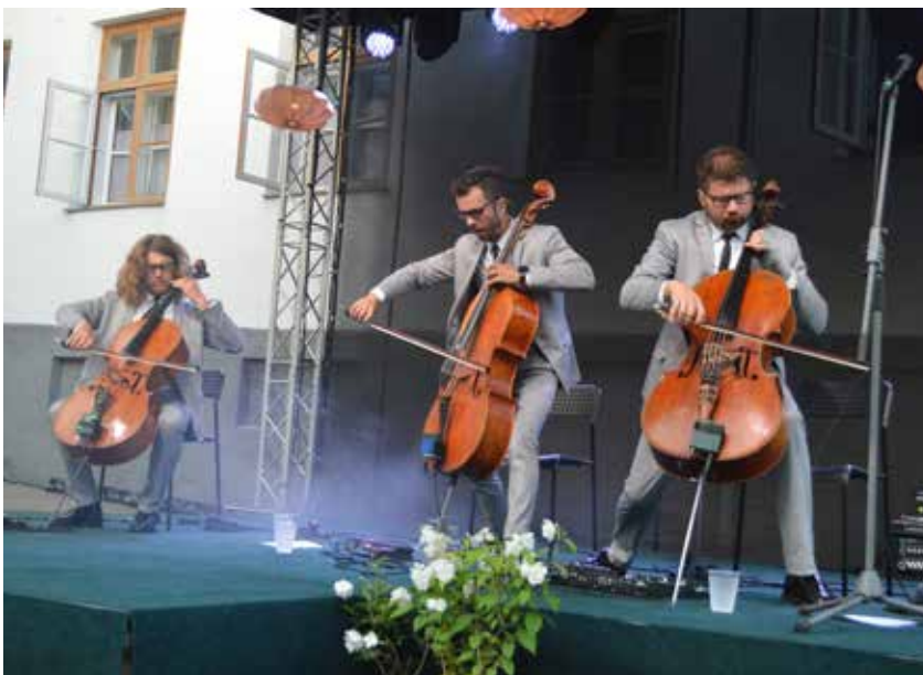
Kalna pagalmā Kuldīgā muzicē čellu trio Melo-M .

Inta Jansone Lailas Liepiņas un Daigas Bitinieces foto