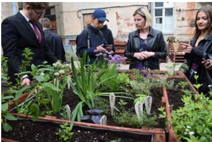
Kuldīgas Tehnoloģiju un tūrisma tehnikuma audzēkņi mēģina nosaukt urbānajā dārzā sastādītos garšaugus.

Kuldīgas Tehnoloģiju un tūrisma tehnikumā (KTTT) atklāts jaunizveidotais pagalms. Tajā ieklāts oļu segums, izveidoti urbānie dārzi ar dažādiem garšaugiem. Turpmāk pagalmā paredzēti pasākumi, un tas ir pieejams visiem.