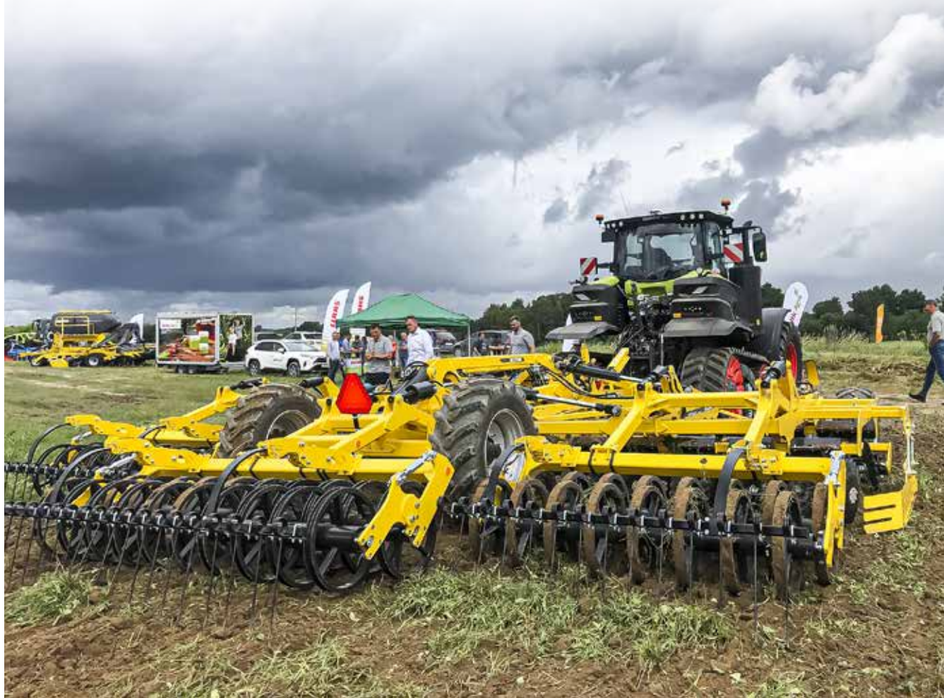
Lauka dienā Laidu Jaunkalnos zemnieki no visas Kurzemes un tālākām vietām sabraukuši aplūkot zīmola Bednar tehniku.

Laidu pagasta zemnieku saimniecībā Jaunkalni Lauka dienā varēja apskatīt ziemas rapšu un kviešu šķirnes, vērot uzņēmuma Baltic Agro Machinery Latvija jaunumu demonstrējumus un saņemt speciālistu padomus gan agronomijā, gan modernās tehnikas lietošanā.