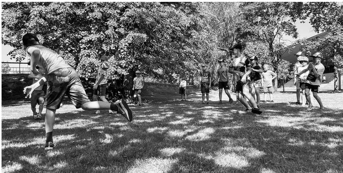
Nometnē Cīnītāja gars Kuldīgas Estrādes parkā ēnā zem kokiem bērni spēlē bumbu spēli Dedzinātāji .