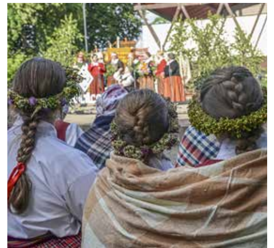
Kurzemes kolektīvi, gan tuvu, gan tālu braukūšie, atzina: festivāls Baltica ir izdevies. Visiem prieks par satikšanos, kas kovidā dēļ divus gadus nebija iespējama.