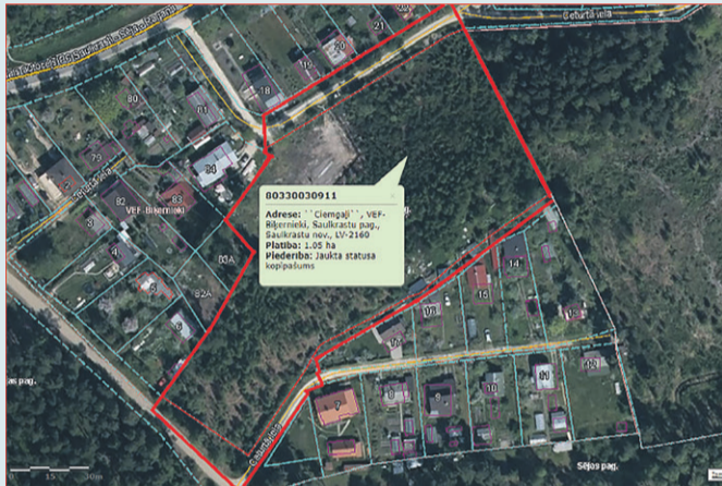
Informācija no mājaslapas www.kadastrs.lv .