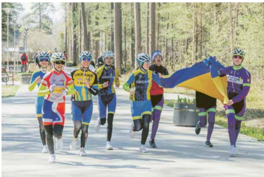
Labdarības skrējienā „Skrien par Latviju, skrien par Ukrainu!” piedalījās arī ukraiņu riteņbraucēju komanda, kura izmitināta Murjāņu sporta ģimnāzijā, kā arī jaunās volejbolistes no Ukrainas, kas uzturas Sējas sporta centrā.

Saulkrastu novada tautas mākslas kolektīvi: Saulkrastu folkloras kopa „Dvīga”, jauktais koris „Sēja”, TDK „Krustu šķērsu”, SDK „Saulgrieži Saulkrastos”, VPK „Jūrdancis” un jauktais koris „Bangotne”.