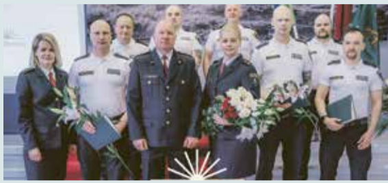
Saulkrastu pašvaldības policijai – 20!