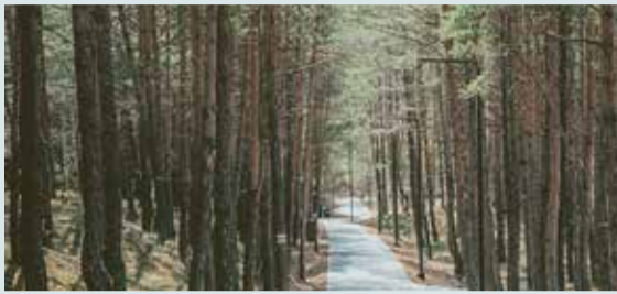
Jauna pastaigu taka Saulkrastos