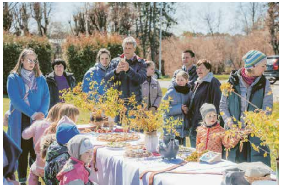
Pie kultūras nama „Zvejniekiems” iedzīvotāji bija paņēmuši savu līdzatnesto mīļāko nacionālo našķi un kopā ar folkloras kopu „Dvīga” svinēja Baltā galdauta svētkus.