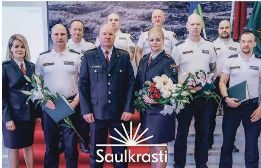
3. maijā svinīgā gaisotnē Saulkrastu novada domes zālē savu 20 gadu jubileju atzīmēja Saulkrastu novada pašvaldības policija. Pasākumā tika pasniegti Atzinības raksti un speciāli veidotas piemiņas zīmes par ieguldījumu policijas darbībā.

Ilva Erkmene, Saulkrastu kultūras centrs, krājuma glabātāja