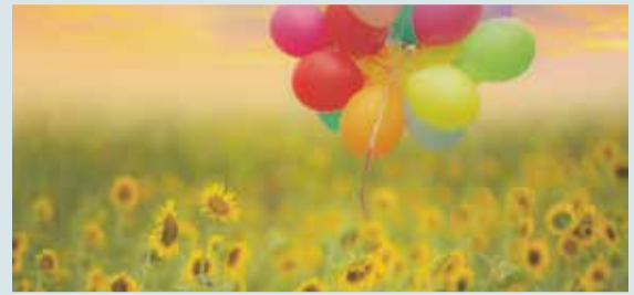
Vasaras pasākumu programma