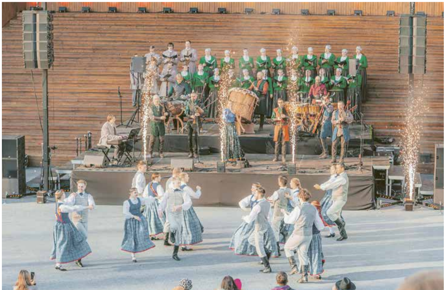
Svētku koncerts par godu Latvijas Republikas Neatkarības atjaunošanas dienai Saulkrastu estrādē.

4. maijā visu dienu svētku noskaņu radīja Saulkrastu kultūras centra veidotie pasākumi. Jau no rīta jebkuram bija iespēja sportiski iesaistīties labdarības skrējienā „Skrien par Latviju, skrien par Ukrainu!”. Lieli un mazi novadnieki tika aicināti skriet, lēnā solī iet vai nūjot kopīgā apmēram divu kilometru distancē apkārt Saulkrastu Meža parkam. Katram skrējiena dalībniekam, kurš reģistrējās, bija iespēja saņemt īpaši veidoto vienoto Latvijas un Ukrainas piespraudīti. Pie reģistrācijas galda bija novietota labdarības organizācijas „Ziedot.lv” kastīte, kurā katram bija iespēja ziedot naudas līdzekļus Ukrainai. Pasākumā pie-