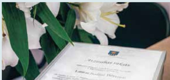
Pasniegti Atzinības raksti