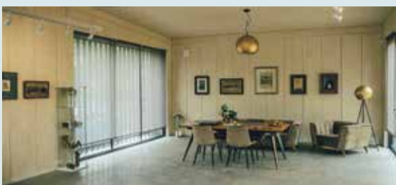
Atklāta jauna radošā māja – arhitekta Bumbiera rezidence