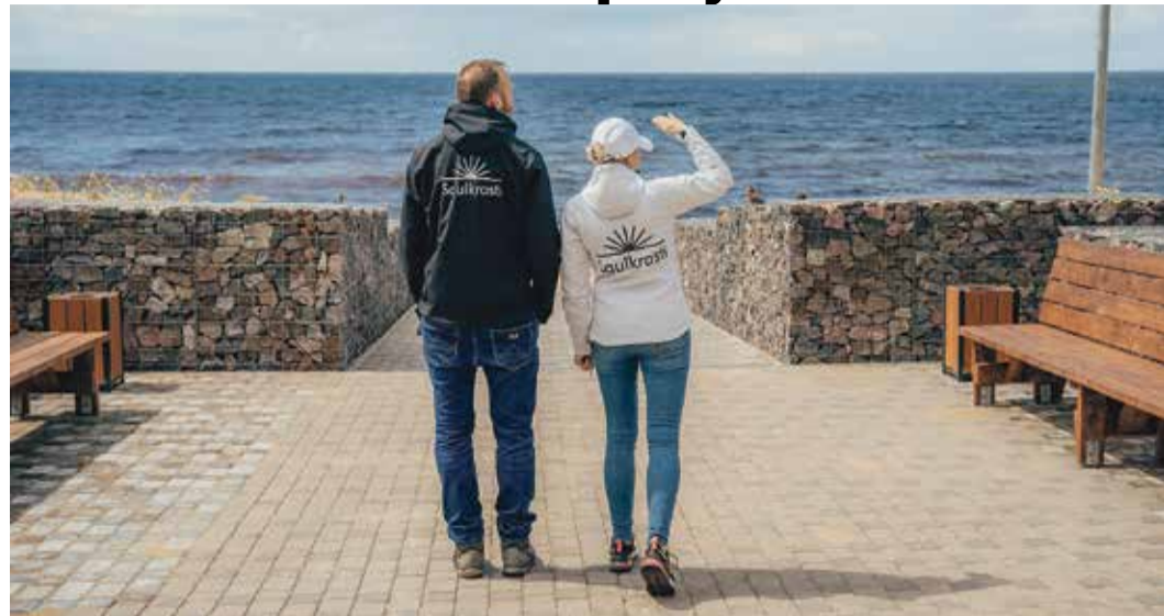
Gabionu sienas izbūve priekškāpā, noejā uz jūru, Jūras parkā.