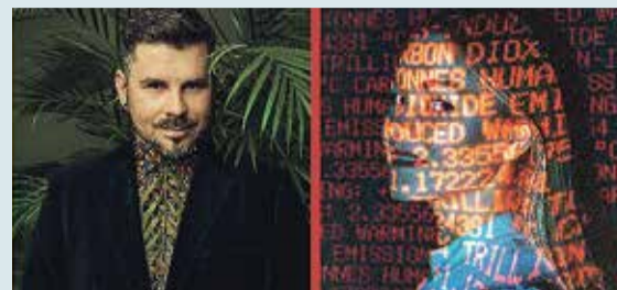
Saulkrastu novada svētki 2022