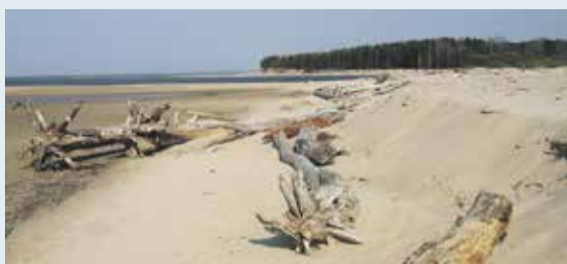
Saulkrastu novads – vasaras atpūtai