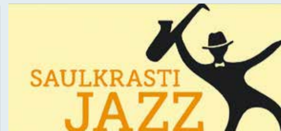
Vasaras pasākumi Saulkrastos