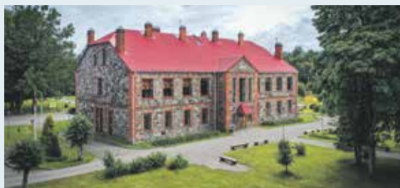
Sējas skolai – 100!