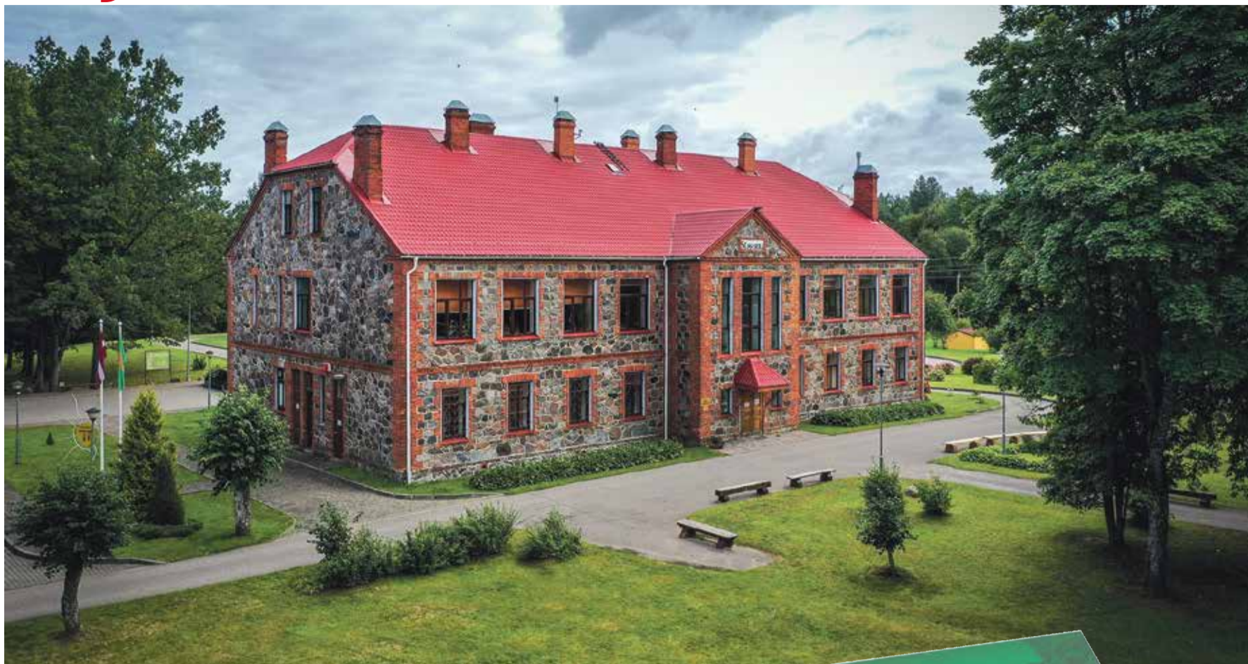
Ligita Šleiere, grāmatas „Sējas skolai 100” autore