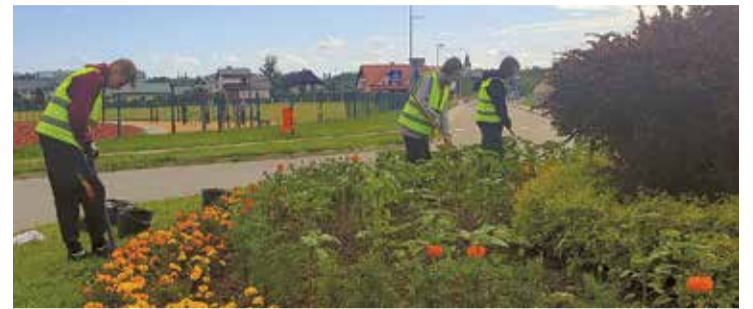
Skolēni palīdz darbos pilsētas Komunālajam dienestam.