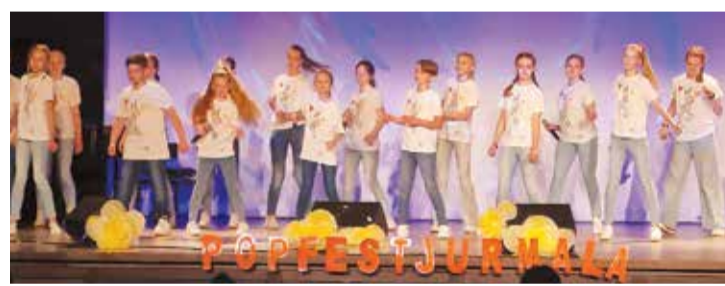
Ansambļu “Vālodzīte” un “Frekvence” dalībnieki.

Jau 13. gadu Jūrmalas kultūras centrā noritēja Latvijas bērnu un jauniešu solistu un popgrupu festivāls – konkurss „POPFESTJŪRMALA XII”.