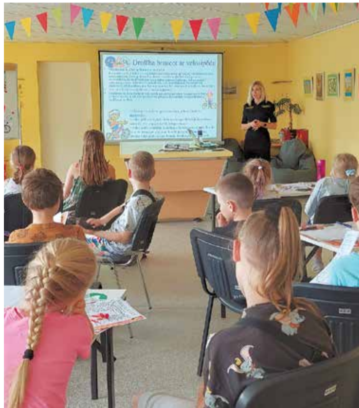
Bērni piedalās informatīvajā lekcijā.