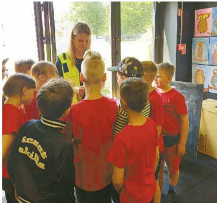
Bērni vēro policijas aprīkojuma demonstrēšanu.

steku, bruņuvestēm, glābšanas vestēm, radiostacijām u.c., nodemonstrējot un pastāstot, kādiem nolūkiem tie paredzēti. Pašvaldības policijas darbinieki atbildēja uz bērnu jautājumiem, tostarp par peldētāju drošību Salaspils pludmalē, arī par pašvaldības policijas darbinieku atalgojumu, kas bērnus ļoti interesēja. Tikšanās laikā bērni pastāstīja arī par saviem novērojumiem ikdienā, piemēram, par videonovērošanas kamerām, ko pamanījuši daudzviet pilsētā, kā arī dalījās stāstos par nepazīstamiem cilvēkiem, kas kādreiz uzrunājuši un piedāvājuši doties līdzī. Bērni arī pastāstīja, ka atrodoties savās mājās bieži novērojuši pašvaldī-