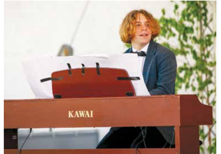
Salaspils mūzikas un mākslas skolas izlaidumā 2022. gada vasarā.