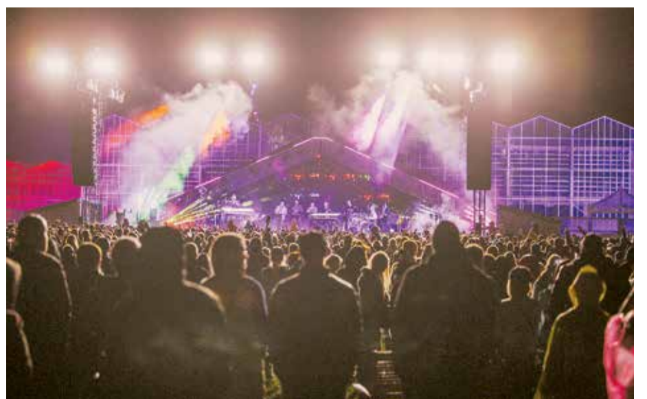
Nacionālajā botāniskajā dārzā!, teic grupas "Instrumenti" dalībnieks Jānis Šipkēvics.

Noslēguma koncertā uz skatuves kāpa grupa "Instrumenti". "Dziedājām, dzīvojam, salijām, saliedējamies un uzplaukām