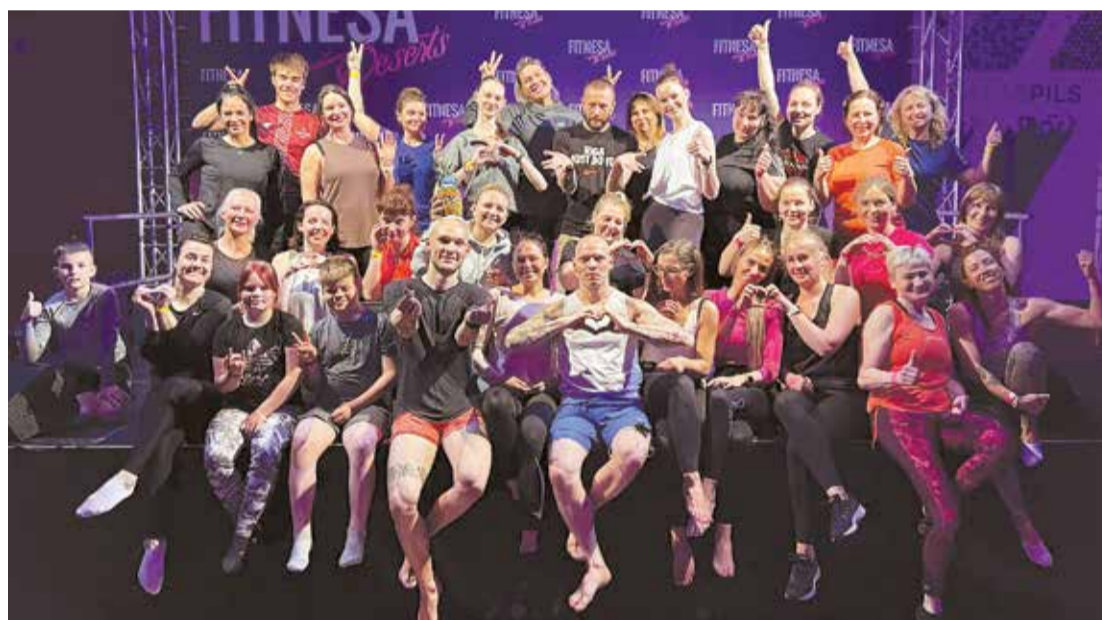
“Fitnesa deserts 2022” dalībnieki.