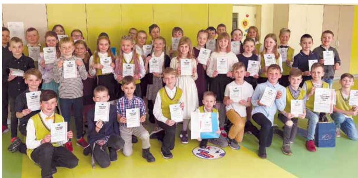
Salaspils 1. vidusskolas 3. klašu skolēni 2021./2022. mācību gada noslēgumā 31.05.2022.

Lepojamies ar mūsu lielisko skolu, skolēniem un pedagogiem! Reitingu var apskatīt http://www.skolureitings.lv