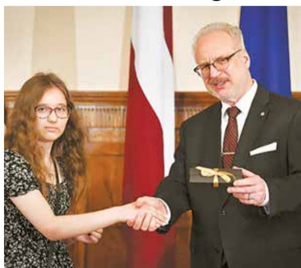
Līva Amberga un Valsts prezidents Egils Levits.