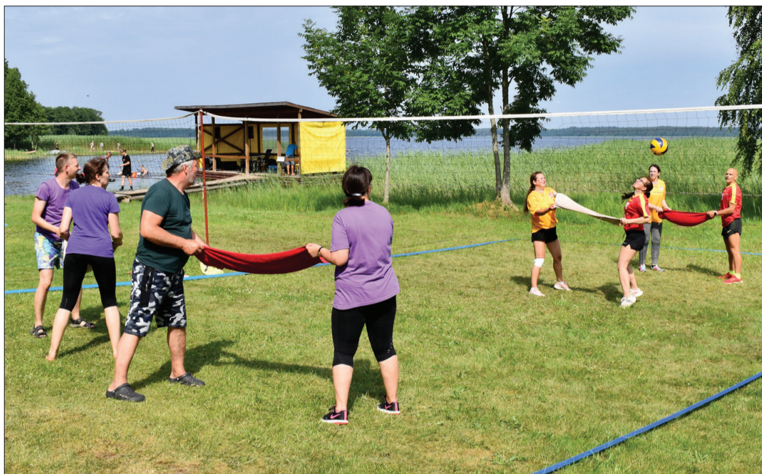
Viena no aktivitātēm, kas tikai izskatījās viegla, bija divieļbols.