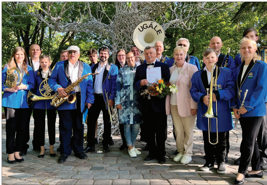
Pūtēju orķestra "Ugāle" dalībnieki Liepājā.