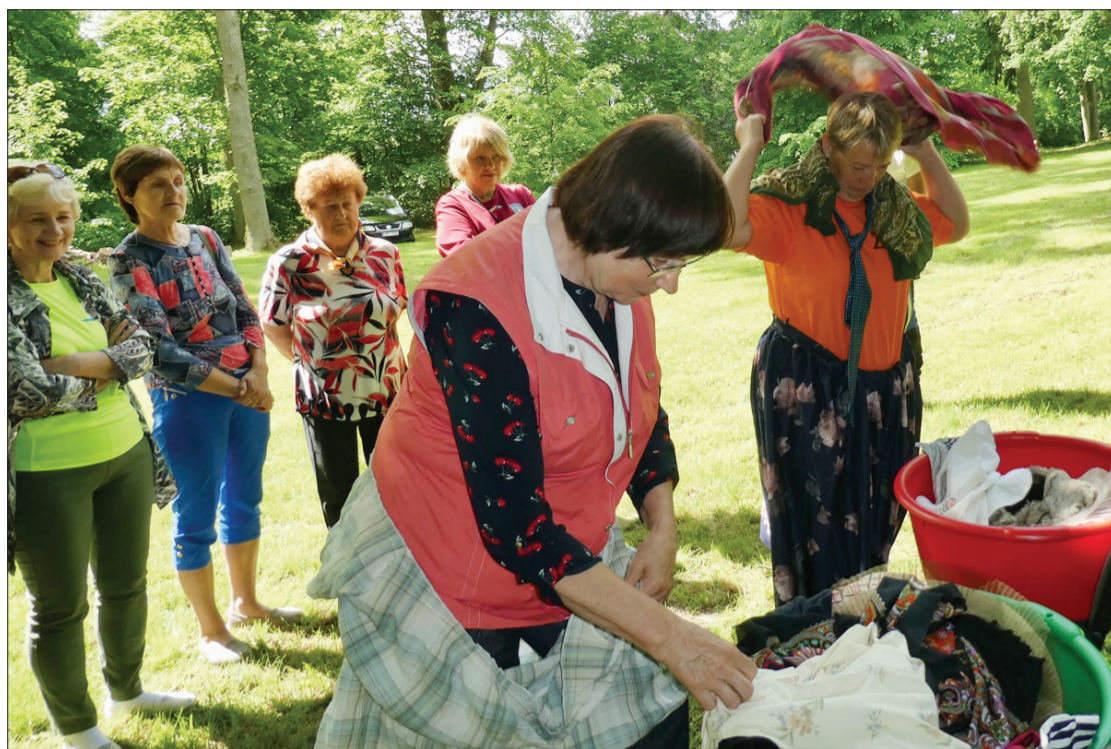
Arī apģērbties ir jāprot pareizi un raiti.