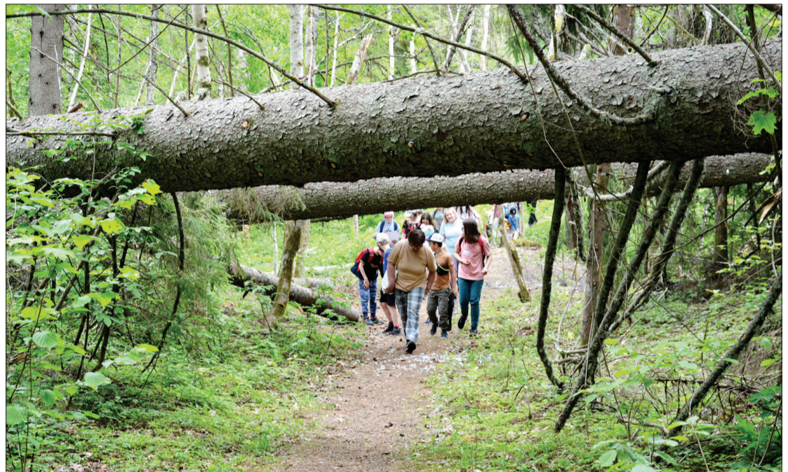
Ugālē paredzēts labiekārtot pastaigu taku, kas jau kļuvusi par iecienītu atpūtas vietu.

Atbalsta Zemkopības ministrija un Lauku atbalsta dienests