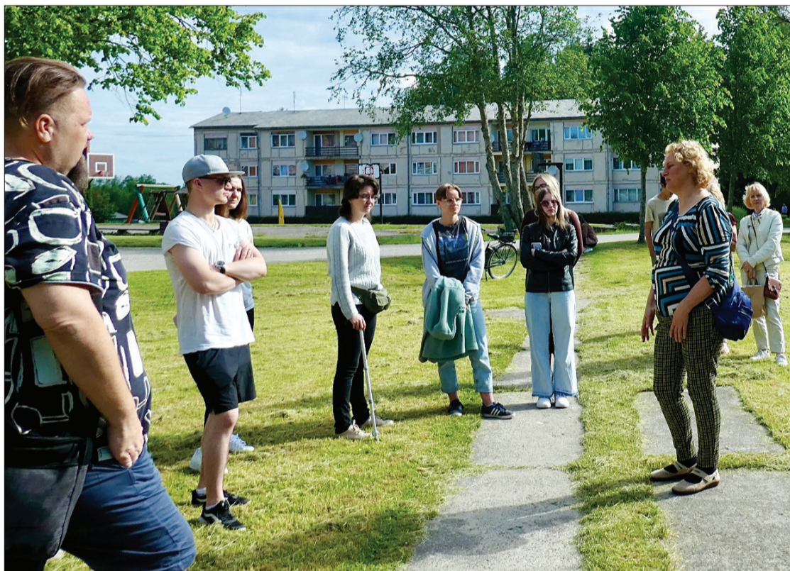
Saruna Puzē pie represētājiem izveidotā pieminekļa.