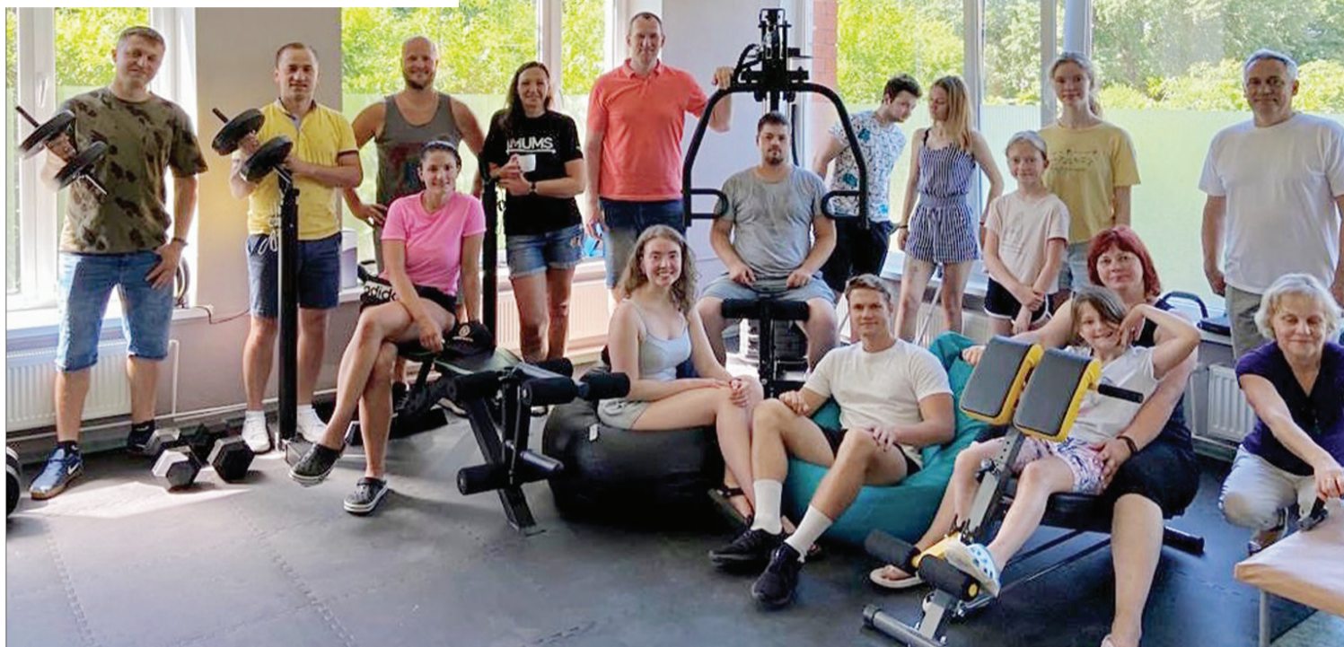
Treniņu zāles atklāšanas pasākuma dalībnieki.

Pirms pieciem mēnešiem jau informējām par projektā paveiktajiem darbiem, kas bija saistīti gan ar inventāra iegādi, gan treniņu un lekciju organizēšanu. Šajos piecos projekta īstenošanas mēnešos noorganizējām tikšanās ar fizioterapeiti, veidojām izaicinājumus un aktivitātes jauniešiem, aicinot viņus pēc iespējas aktīvāk pavadīt savu ikdienu. Devām iespēju jauniešiem aizvadīt treniņu kopā ar citu jauniešu. Atbildīgi iekārtojām telpas, lai tās būtu pēc iespējas piemērotākas jauniešiem un sporta aktivitātēm, veicām projektā iesaistīto jauniešu progresu apkopojumu, kas ļāva secināt, ka sniedzam jauniešiem ļoti vērtīgu iespēju gan uzlabot fizisko formu, gan uzlādēties emocionāli, treniņzāles apmeklējuma laikā komunicējot ar citiem treniņu biedriem. Sarī-