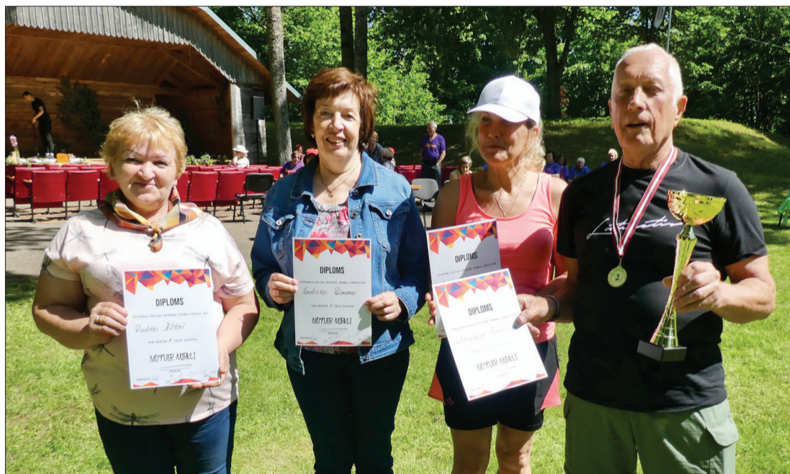
Komandu stafetēs 1. vieta bija pilteniekiem.