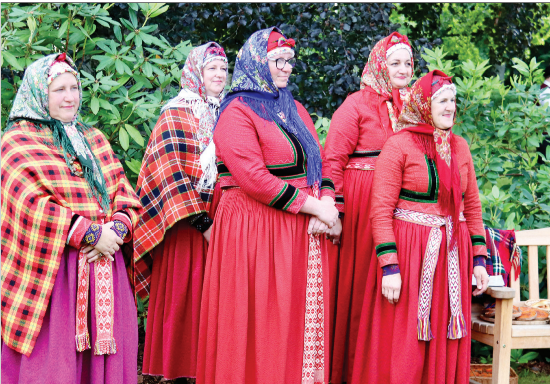
"Maģo suitu" dziedātājas organizēja aktivitātes placī "Ai, galdiņi, ai, galdiņi!"