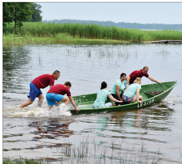
Lielās stafetes noslēguma posms, kad puīši stumj meitenes laivā apkārt bojai.

Usmas pagasta pludmalē norisinājās "Sporta spēles 2022". Sacensības organizēja un vadīja novada sporta organizatori. Sporta spēlēs piedalījās novada iedzīvotāji no Piltenes pilsētas un Popes, Puzes, Ugāles, Užavas, Tārgales, Vārves un Zlēku pagasta, kā arī novada pašvaldības darbinieki.