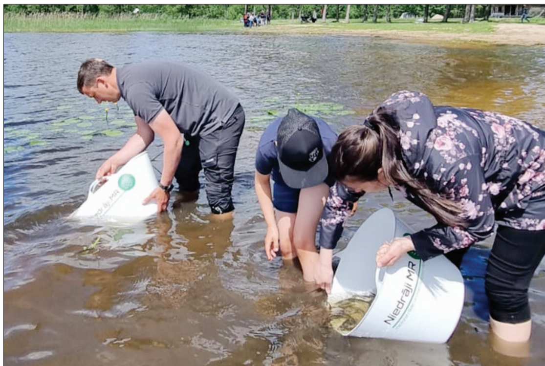
Pie 20 500 vienasaras līdaku mazuļu ielaišanas Usmas ezerā klāt bija arī bērni.