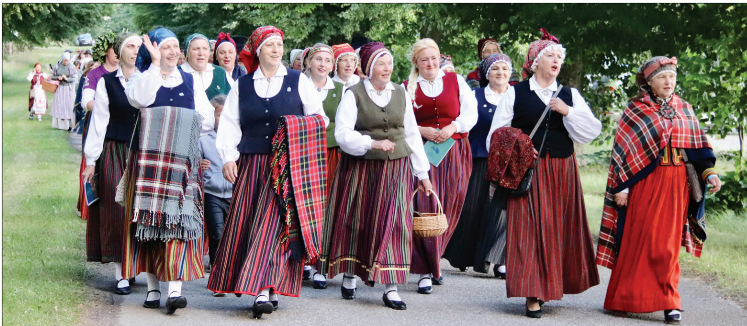
"Pūnikas" vadībā folkloristi devās uz estrādi, lai satiktos koncertā "Saspēlējam, sadziedam Popē".

No 6. līdz 10. jūlijam vairāk nekā 250 folkloras kopas un etnogrāfiskie ansambļi Latvijā tikās starptautiskajā folkloras festivālā "Baltica".