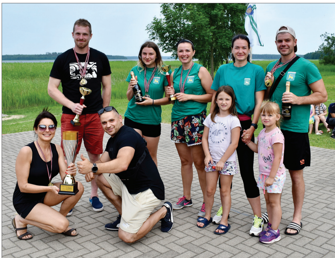
Lielās stafetes uzvarētāji ugāļnieki ar saņemto kausu.