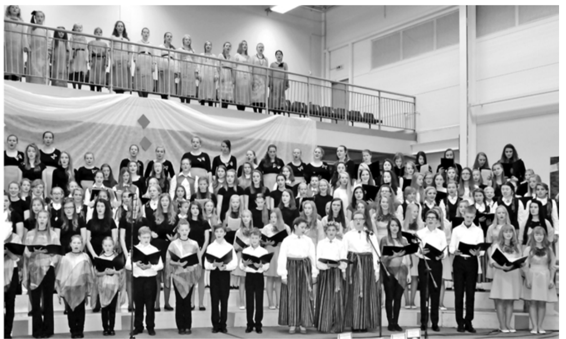
Vidzemes un Rīgas mūzikas skolu audzēkņu kopkoris