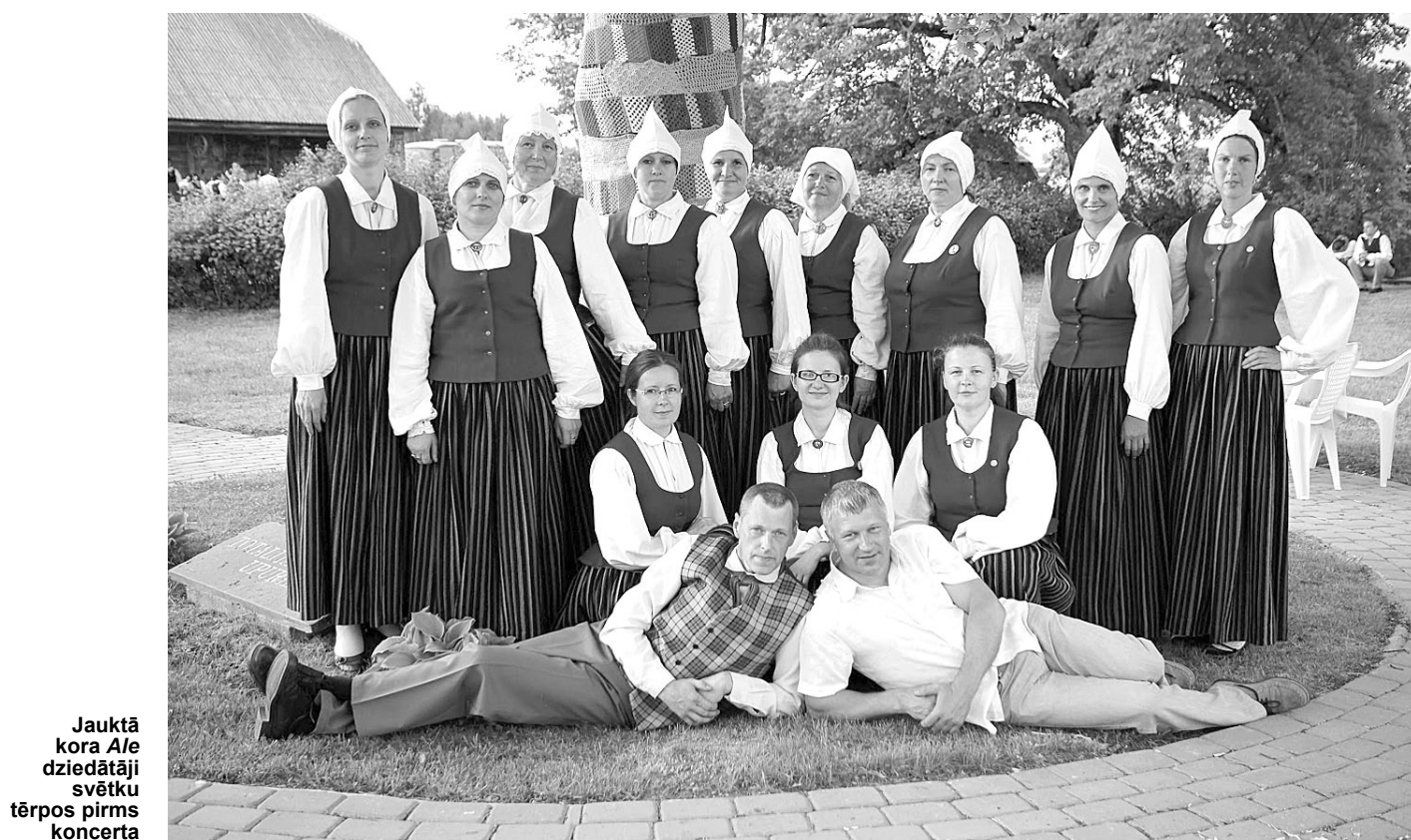
Jaukta kora Ale dziedātāji svētku tērpos pirms koncerta

Melngaiļa svētki tiek atzīmēti ik pēc 5 gadiem. Pirmo reizi programmā tika iekļauti arī bērni un jaunieši, kuri ar savām skanīgajām balsīm ieskandināja šo saulaino, karsto un tveicīgo dienu koncertā Gaismiņa ausa . Pēc tā svētku viesi un dalībnieki varēja noklausīties garīgās mūzikas koncertu Igates Sv. Jāņa Kristītāja un Marijas Magdalēnas baznīcā. Turpat ne daudz vēlāk notika arī ekumeniskais diev-