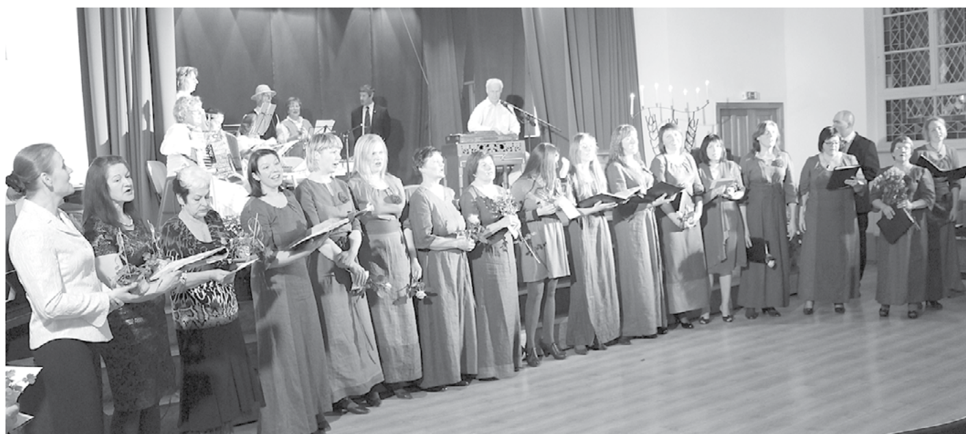
Jubilejas reizē kopā dzied Heihēras esošie un kādreizējie dalībnieki