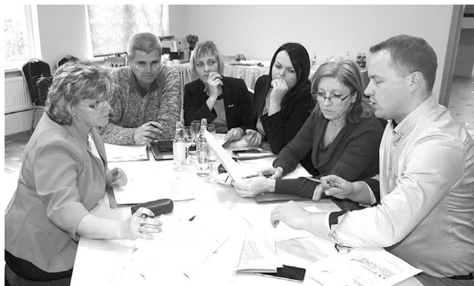
Viena no tīkla sanāksmes darba grupām, diskutējot par iedzīvotāju grupu izvērtēšanas principiem sociālo dzīvokļu piešķiršanā

- Pat vairāki kolēģi no Rīgas atzina, ka gribētu bērnus laist tādā bērnudārzā, kāds ir Vilzēnos, tomēr mums vēl daudz