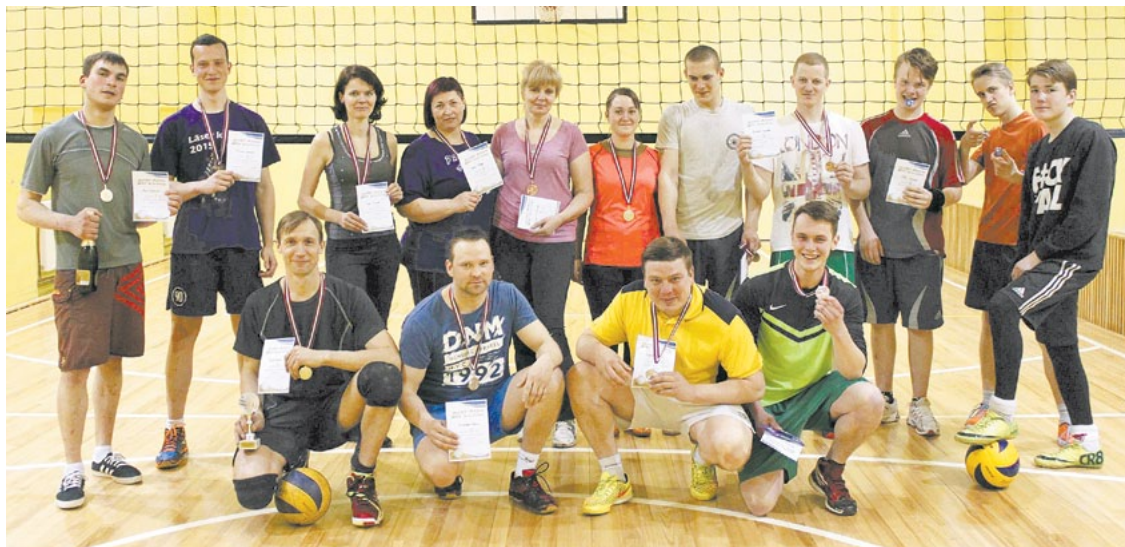
Visi Alojas novada volejbola turnīra dalībnieki vienuviet

27. aprīlī Staiceles vidusskolas sporta zālē tikās Alojas novada volejbola spēles cienītāji, lai noskaidrotu labākos, spēlējot 4:4. Kopumā pieteicās un spēlēs piedalījās četras komandas: Juris , Paaužu maiņa , Līvānciems un OldSchool .