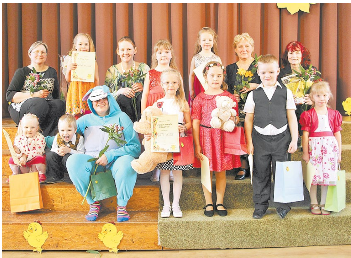
Mazo dziedātāju konkursa dalībnieki kopā ar savām skolotājām un pasākuma vadītāju Ēzelīti