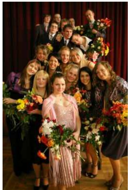
12-ie tikko saņēmuši žetonus un apsveikumus un...