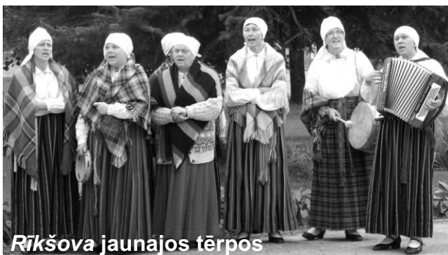
Rīkšova jaunajos tērpos

24.septembrī atklāta Brīvu TN renovētā ēka. Lauku atbalsta dienesta finansējums Ls 77 990 nodrošināja fasādes siltināšanu, durvju, logu, grīdu nomaiņu. Tautas nams ir pārvērties, kļuvis plašs, gaišs un aicina pagasta ļaudis uz pasākumiem. Zāle tiks papildināta ar 40 jauniem krēsliem un kabineta mēbelēm.