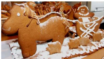
Fotogrāfijās - Mārites Lipskas piparkūku sveiceni svētkos