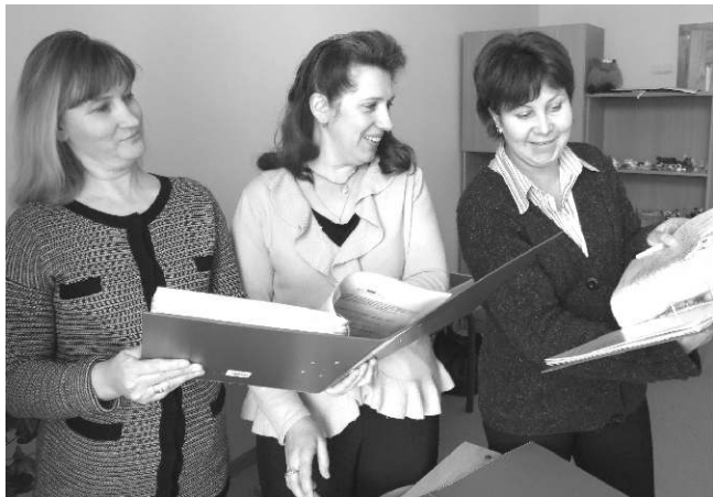
Skolotāji gatavo atskaiti portfolio mapes