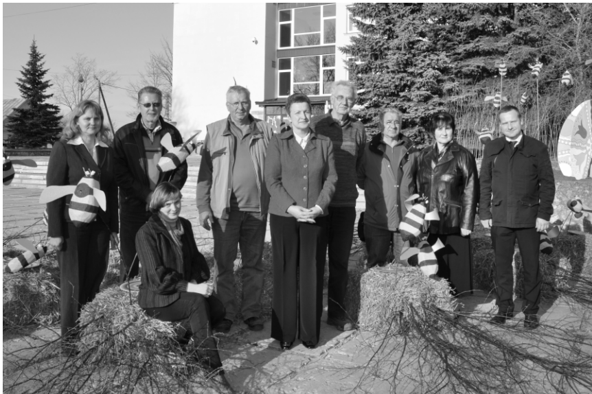
Ludzas novada pašvaldības un draugu no Bad Bodenteihas tikšanās laikā