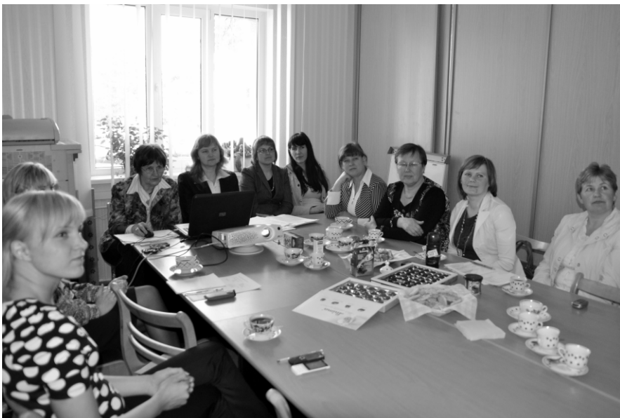
Ludzas novada sociālie darbinieki seminārā uzzināja daudz interesanta.