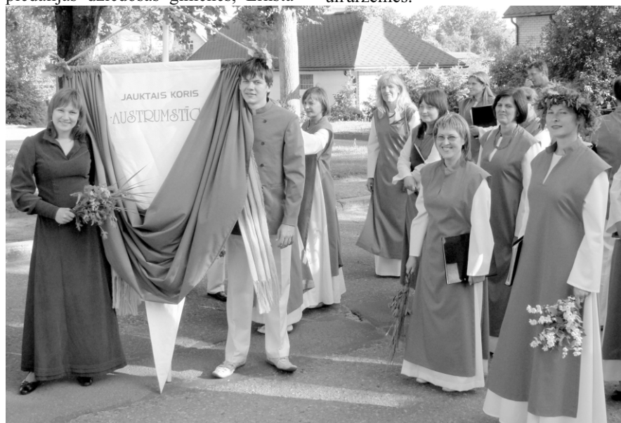
«Austrumstīgas» dalībnieki Dzienu dienā Alūksnē.