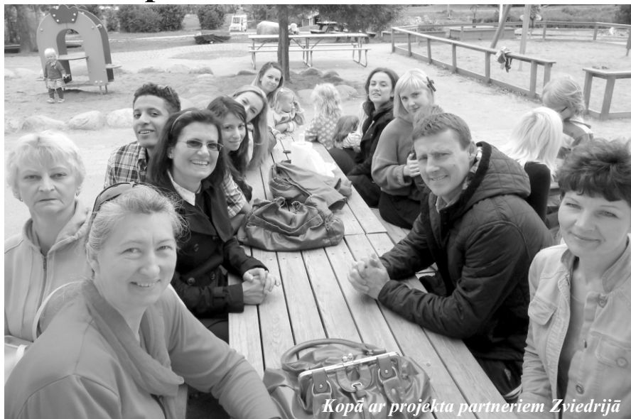
Kopā ar projekta partneriem Zviedrijā

Ludzas pilsētas 3. pirmsskolas izglītības iestāde „Namiņš” kopš 2010.gada 1.augusta piedalās Mūzizglītības programmas Comenius projektā „Mini magic steps”. Aktivitātes tiek realizētas par ES projektam piešķirtajiem līdzekļiem. Projekta mērķis ir iepazīstināt iestādes pedagogus un bērnus ar Eiropas tautu kultūru, tradīcijām, veikt pieredzes apmaiņu. Tajā piedalās pārstāvji no sešām dalībvalstīm – Latvijas, Lietuvas, Anglijas, Ungārijas, Turcijas un Zviedrijas. Projektam ir arī savs logo.