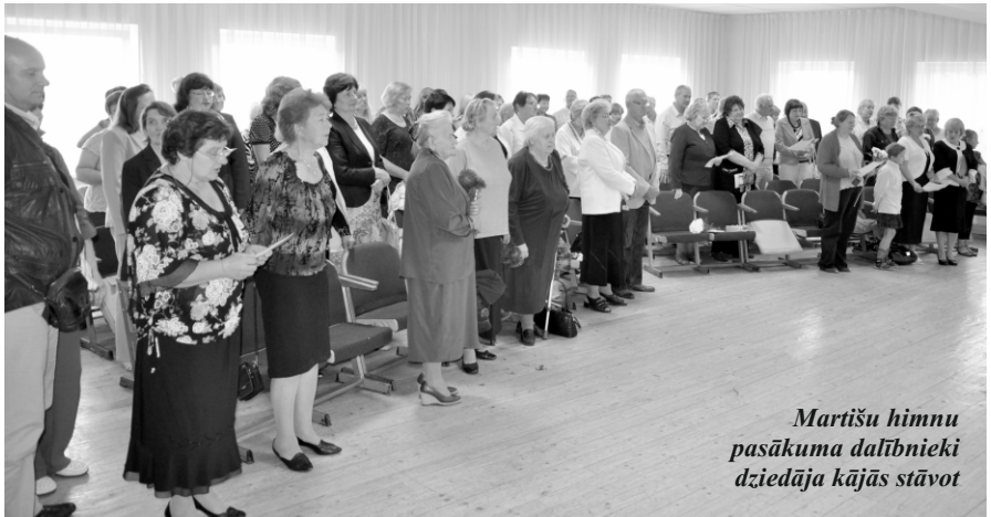
Martišu himnu pasākuma dalībnieki dziedāja kājās stāvot

Te, Latvju zemē – Latgalē, mēs stāvam Ar krusta zīmi savās dvēselēs. Jūs, Martiši, – mums vienīgie un mīļie Uz visas plašās Dieva pasaules.