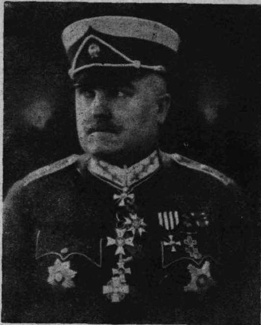
Armijas komandiers ģenerālis Penki, bijis galvenā štāba priekšnieks no 1920. g. 30. jūlija līdz 1928. g. 21. aprīlim.

Pēdējās nedēļas ievērojami pieauguši Latvijas bankas sudraba naudas krājumi. Tā vienas nedēļas laikā, t. i. no 27. novembra līdz 4. decembrim šie krājumi pārvairojušies par 900.000 ls, no 3.035,873 uz 3.932,199 ls. Tas izskaidrojams ar to, ka banka izlaidusi pēdējās nedēļas apgrozībā par vairākiem miljoniem latu jaunās 25 ls banknotes.