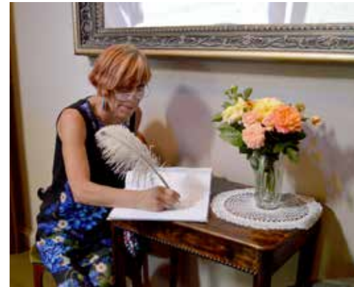
Apmeklētāji labprāt bauda muzeja interjeru un, rakstot ar spalvu atsauksmi, var pasēdēt arī uz senām mēbelēm.