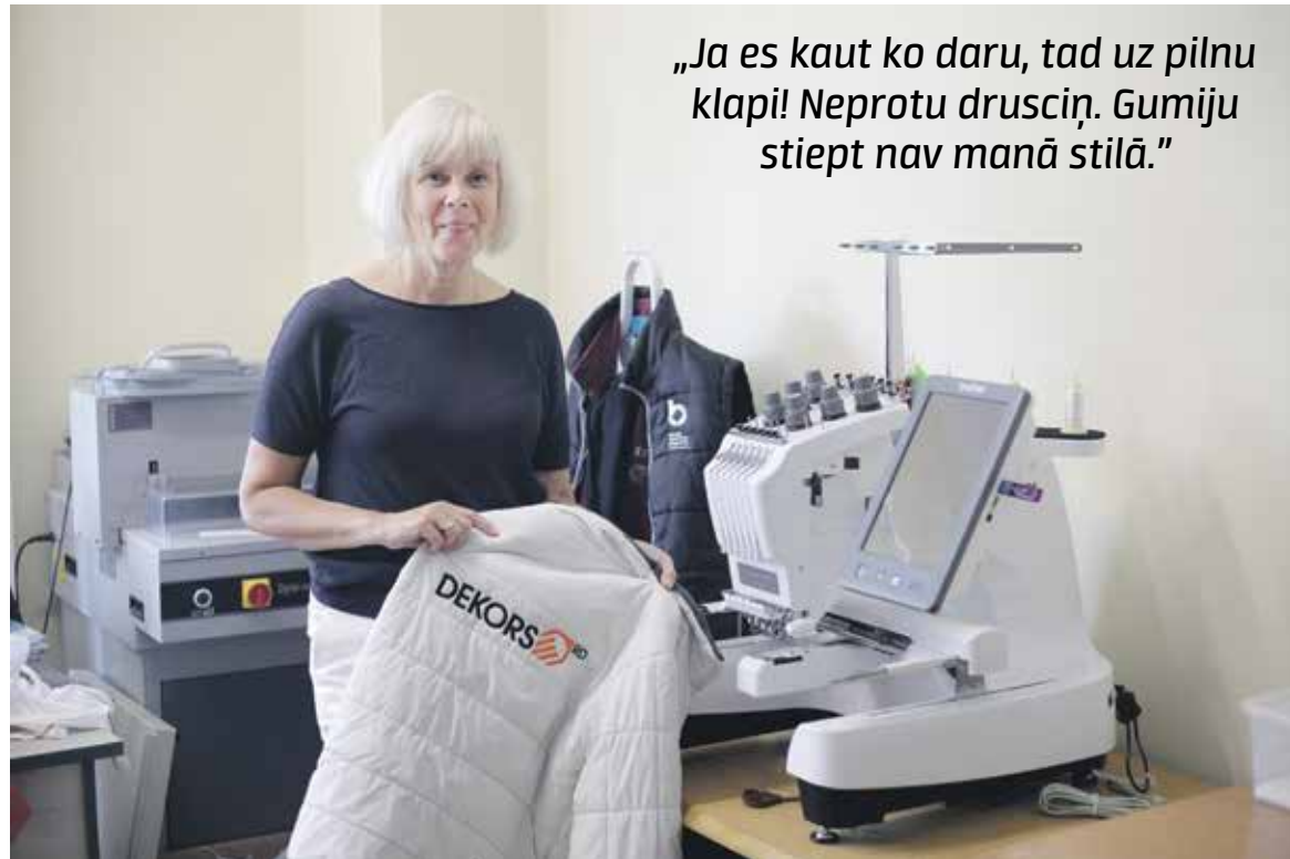
„Ja es kaut ko daru, tad uz pilnu klapi! Nepratu drusciņ. Gumiju stiept nav manā stilā.”

Sākumā bija bez RD. Dekors tādēļ, ka tieši norāda uz to, ko darām, – dekorējām. Burtus RD (reklāmu darbnīca vai reklāma un dizains – kas nu kuram labāk patīk) pielikām klāt, jo izradījās, ka Kuldīgā ir vēl viens uzņēmums ar tādu nosaukumu. Mēs vēl bijām kā individuālais uzņēmums, tas otrs – SIA, tādēļ nosaukumu mainījām mēs. Sākumā darbojāmies