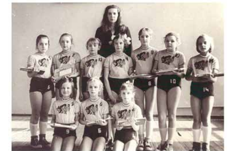
Anda (otrā rindā vidū) ar minibasketbola komandu pēc pirmās Latvijas PSR čempionu medaļas 1976. gadā. Vēlāk ar šo komandu basketbolā izcīnītas dažāda kaluma medaļas Latvijas čempionātos dažādās vecuma grupās.