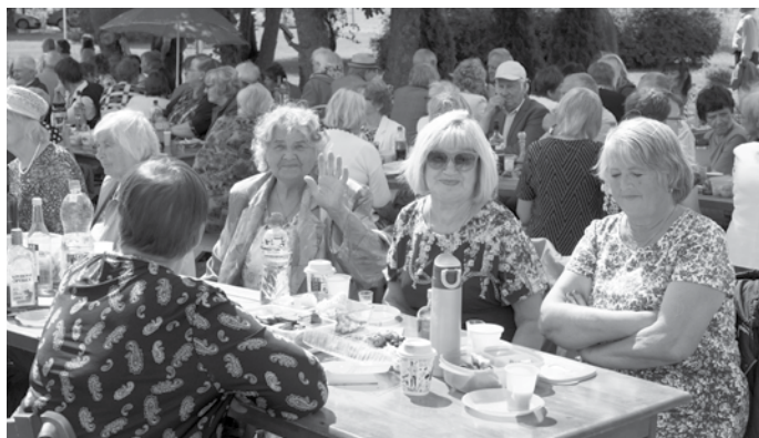
Kurmāles pagasta seniori saietam pieteikušies aktīvi.

Šovasar beidzot tika dota zaļā gaisma, ka drīkst notikt Kuldīgas novada senioru saiets. Ar nosaukumu Es bij' laba saimenece 28. jūlijā tas norisinājās Gudeniekos.