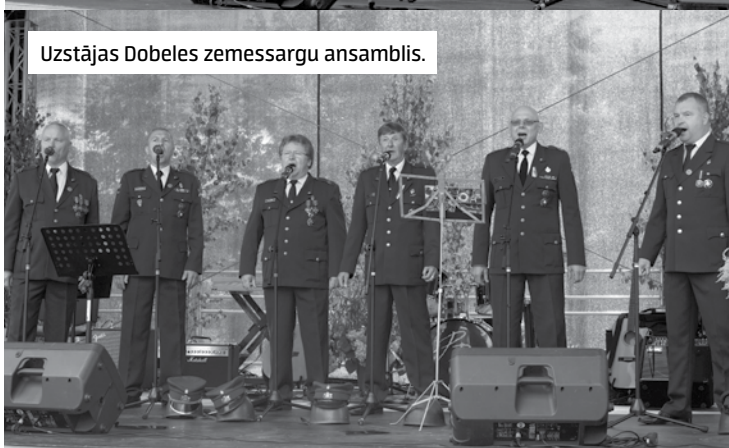
Uzstājas Dobeles zemessargu ansamblis.