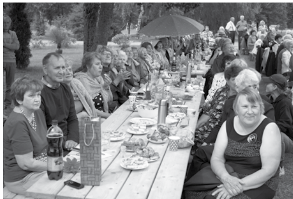
Gudenieku cilvēki priecājas par pasākumu viņu pagastā.