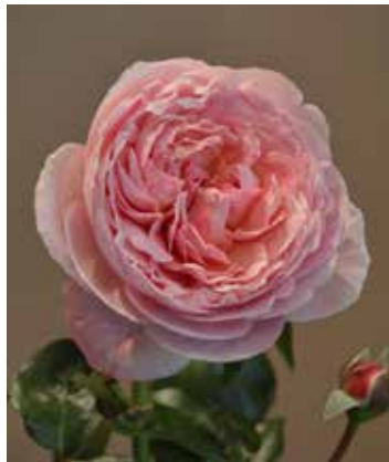
Krūmroze 'Kölner Flora'.