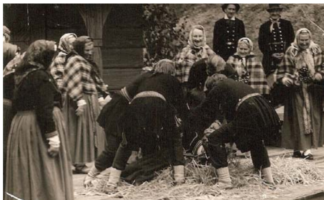
Tas gan bi' sen, kad „Suitu kāzu” uzvedumā puīši meitas siena čupā gāz'!