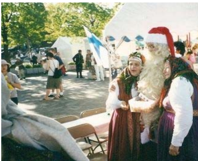
Salatēss vasare- tā var notikt tikai Japāne un... suitenēm.