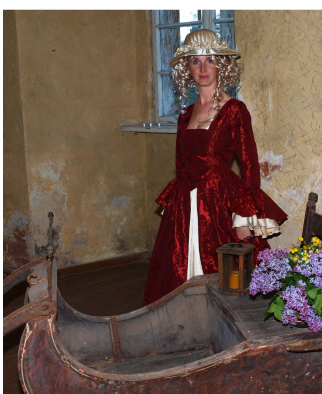
Suitu lebediks pilī