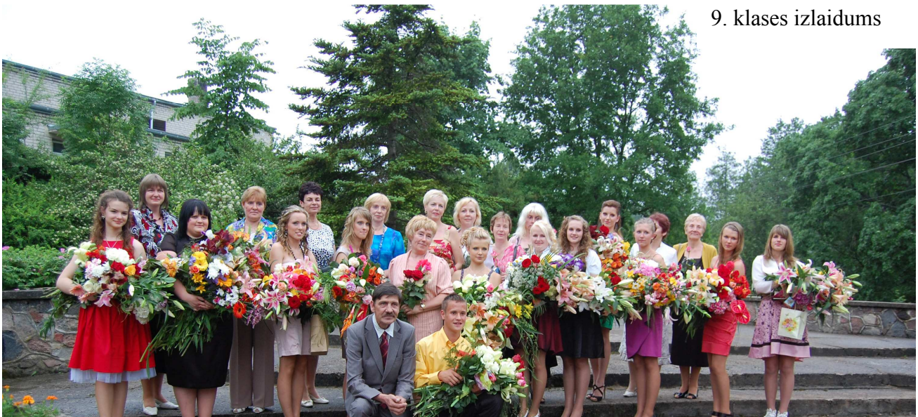
9. klases izlaidums

Projekti jāiesniedz personīgi filiālēs/norēķinu grupās vai sūtot pa pastu: Kuldīgas norēķinu grupa: Smilšu iela 24, Kuldīga, LV-3300;