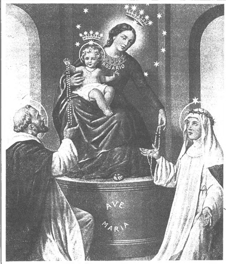
Svētās Marijas Rožukroņa baznīcas altārglezna.