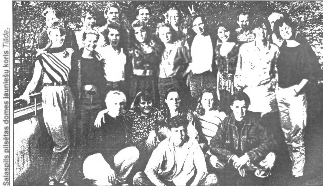
Salaspils pilsētas domes jauniešu koris. Tiāde .

patīk. Protams, ka jauniešiem ir arī citas intereses - tagad pat - pavasaris galvā, bet tas ir saprotams.