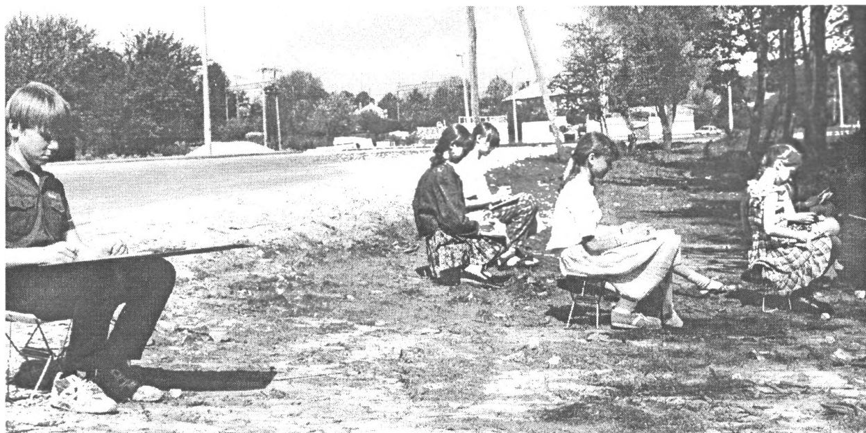
Mākslas nodaļas audzēkņi zaļajā praksē .