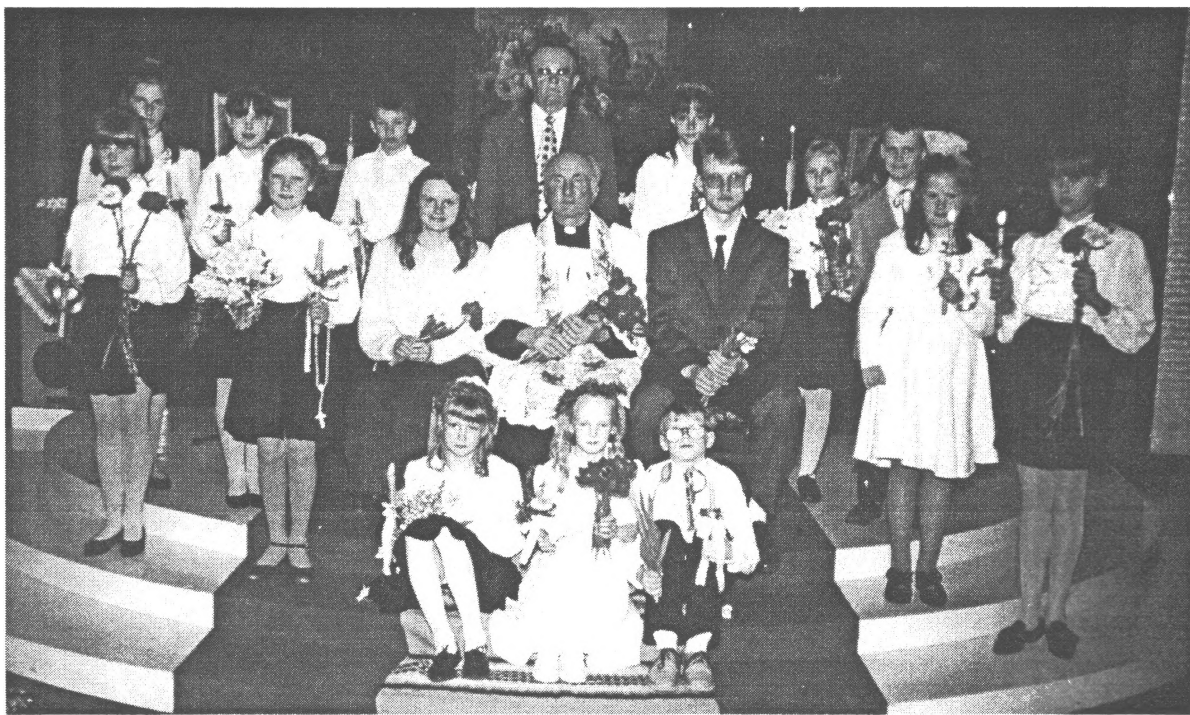
savus bērnus pie draudzes priekšsēdētāja, Līvzemes ielā 16-6, tālrunis 46975. □

Darbs svētdienas skolā turpinās. Lūdzam pieteikt