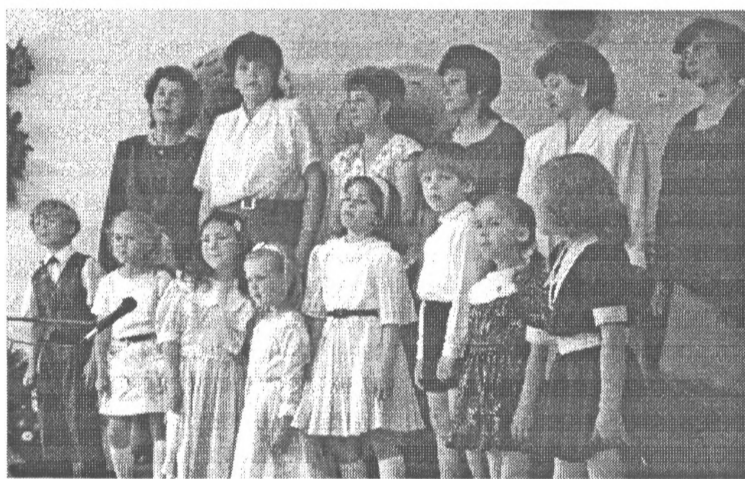
Piektdien, 7. jūnijā, notika Salaspils pilsētas bērnodarza 25 gadu jubilejas svinības. Jubilāra viesiem dziedāja arī audzinātāju un bērnu apvienotais ansamblis.