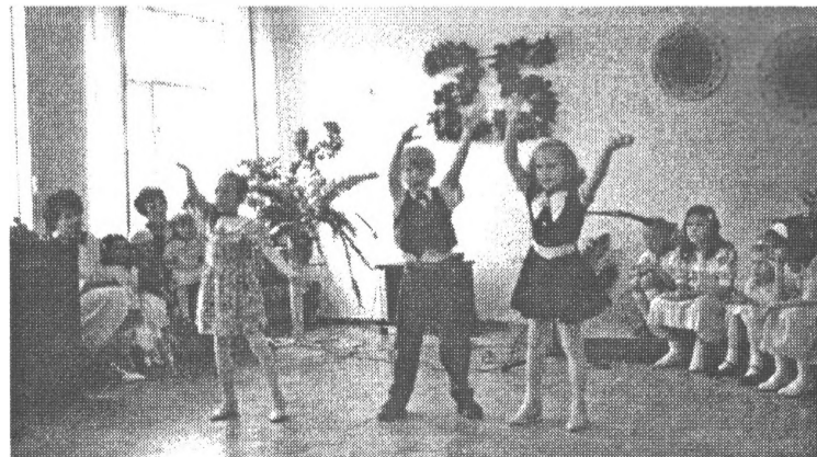
Tagadējie bērnodarza audzēkņi bija samācījušies labi daudz dziesmu un deju - viņu uzstāšanās Ielie viesi uznēma ar ovācijām!