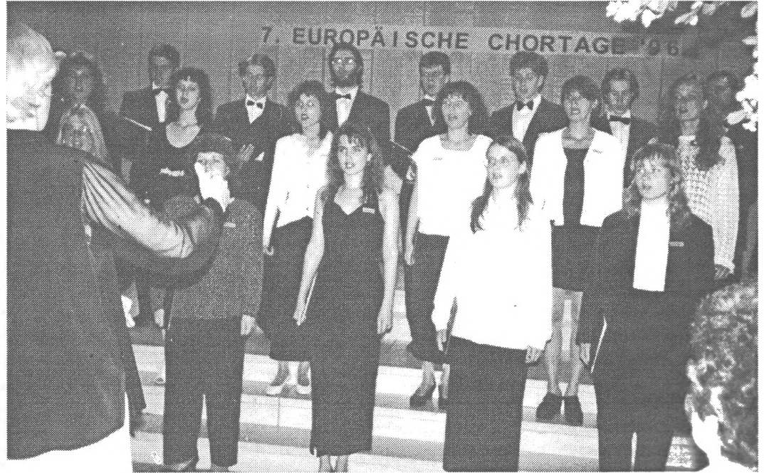
Atklāšanas koncerts Sv. Magnusa baznīcā.

Organizatoriski festivāls bija ļoti augstā līmenī. Lielu atbalstu tam sniedz arī Brēmenes pilsēta - visas pusdienas un vakariņas mums bija apmaksātas, uz koncertiem un mēģinājumiem atveda un aizveda. Varēja just, ka šis festivāls arī Brēmenei ir ļoti nozīmīgs. Un nav jau nekāds brīnums, jo vā-