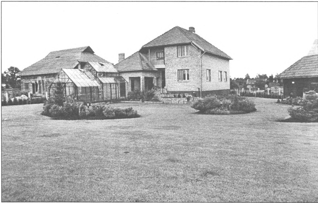
Ilmāra Vamža mājas dārzā...