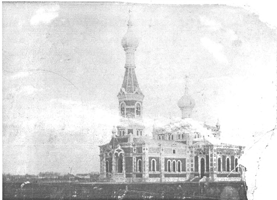
Tāda, lūk, izskatījās Salaspils pareizticīgo baznīca, kuru nopostīja 1. Pasaules kara laikā.

uz Rīgu, ka vairākkārt nākas piesēst, lai atpūstos." Es vaicāju: "Bet kur jūs Salaspilī redzat katoļu baznīcu?" - "To, lūk, ceļ, bet mums joprojām - nekā..." Dzirdētais kā smagums uzgūla sirdij. Iepriekšējās varas gadu desmitos esam aizmirsuši gan par tikumību, gan īstu ticību. Cilvēks, kurš dzīvo tikai miesai, nespēj domāt par dvēseles glābšanu. Bet pareizticība, gluži kā ikviena kristīgā ticība, glābj cilvēku dvēseles, dziedina tās, jo Dievs, lūk, teicis: "Ko līdz, ja cilvēkam pieder visa pasaule, ja viņš pazaudējis savu dvēseli?" "To apziņoties, es sapratu, ka man kaut kas ir jādara. Palūdzu satikto sievieti saaicināt cilvēkus (tas notika Lieldienās), aprunājāties, un visi sanākušie piekrita, ka jāsāk ir ar dvēseles augšāmcelšanu, bet pareizticība taču iesākās ar templi.