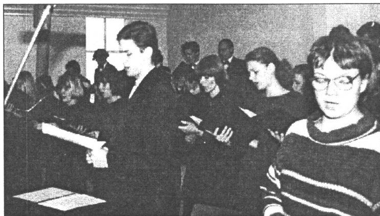
Jau no septembra sākuma šim lielajam notikumam gatavojās pilsētas jauniešu koris Tiāde , kura repertuārā tagad ir plaša gariģo dziesmu programma.

Dievkalpojumi ar Sv.Misi notiks IK DIENAS, pl. 17: svētdienās un svētku dienās pl. 13: prāvests satiekams darbdienās no 16-18, svētdienās no 12-15. 15. uz 16. novembra naktī (no 21 līdz 6 rītā) notiks nakts vīgilijas (dievkalpojums). Sv. Mise -24.00. Sestdien, 16.novembrī, 11 notiks bērnu un jauniešu Rožukroņa salldojums.