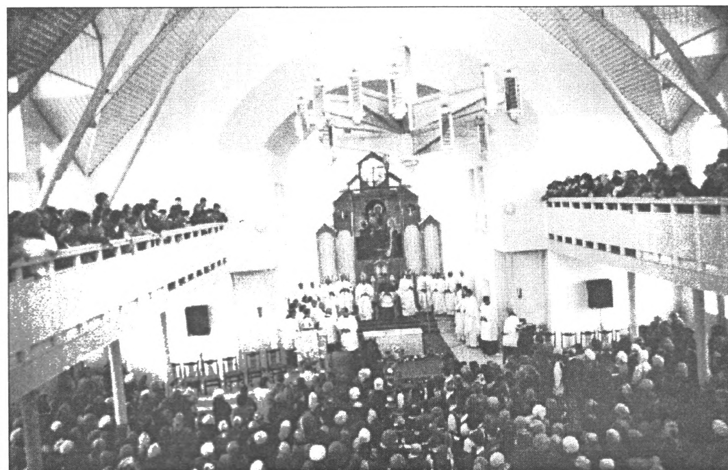
Svētā Rožukroņa Karalienes dievnama iekšskats tā atklāšanas dienā.