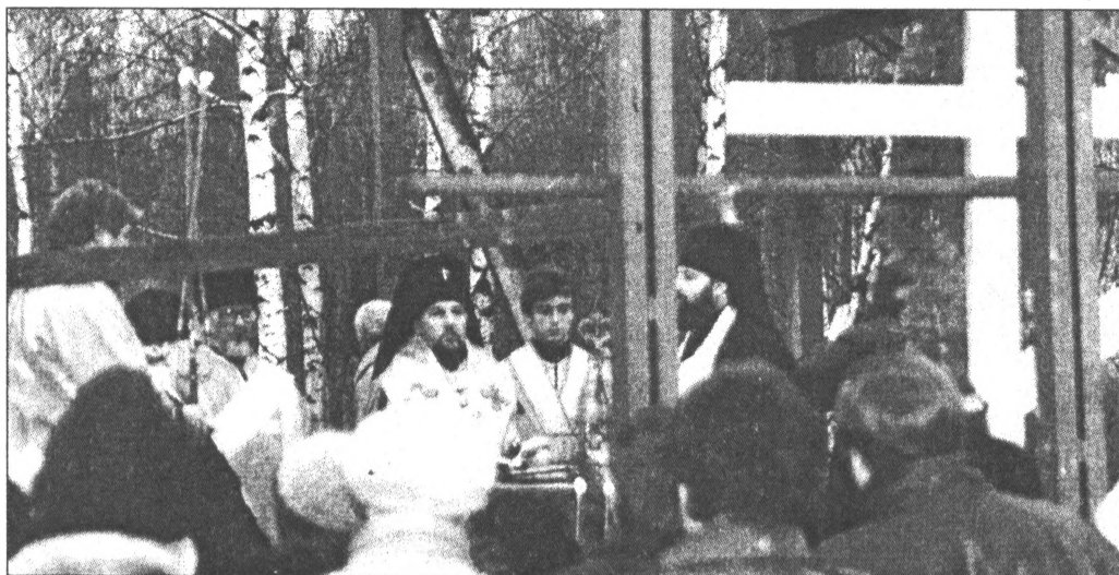
1. decembrī Salaspils jaunās pareizticīgo baznīcas zemi un celtniecību iesvētīja Rīgas un Latvijas arhibīskaps Aleksandrs.