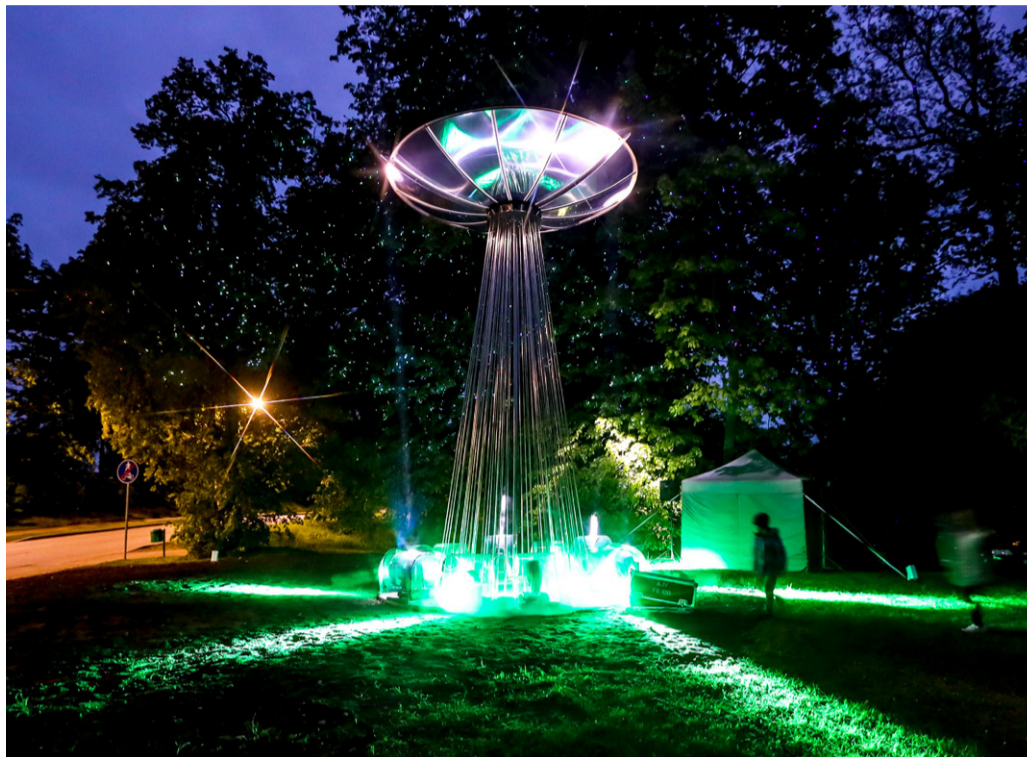
Madonā uzstādīts jauns vides objekts.

▪ Darbi jāiesniedz personīgi Madonas novada bibliotē-