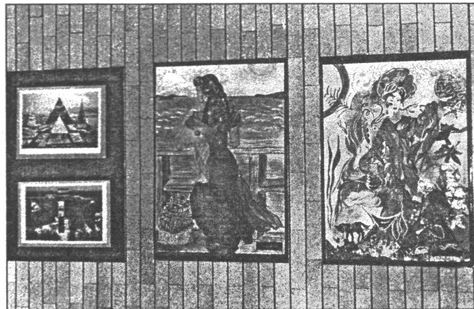
2. vidusskolas skolēnu kolāžas.