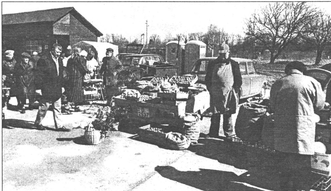
Salaspils tirgū: pārdevēju - daudz, pircēju - trūkst.