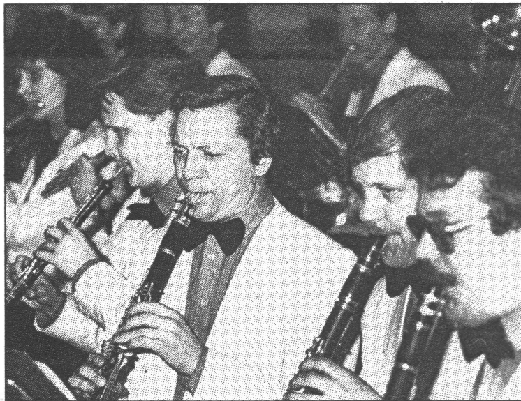
..Klarnetes spēli apguvu pašmācības ceļā..

Veselības dēļ biju atbrīvots no armijas. Man bija jau gandrīz 25 gadi, kad paziņoja, ka esmu derīgs un būs vien jāpilda svētais pienākums pret dzimteni - jāiet dienēt