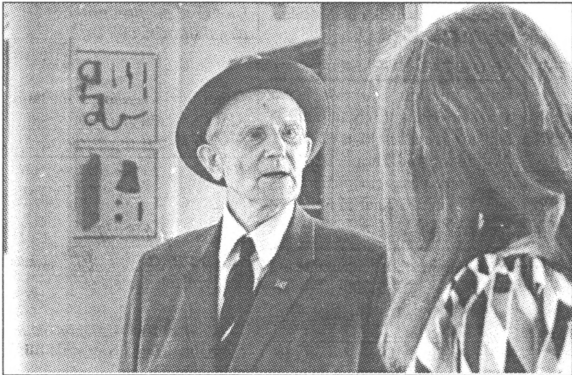
2. Tūlīt pēc muzeja atklāšanas to apmeklē LKP CK sekretārs Jānis Kalnberziņš.