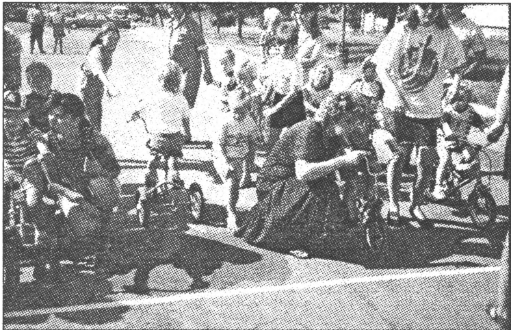
● Pēdējie norādījumi pirms starta.