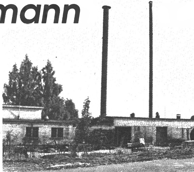
● Saulkalnes katlu mājā jau notiek rekonstrukcijas darbi.