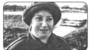
Nīna, ne ar ko nenodarbojas

Vēl ne, bet taisāmie. Mēs vēl nesam izlēmumi.