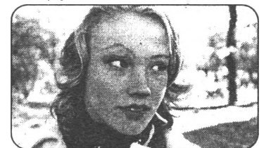
Inā, auklē bērnu

Vēl ne. Mēs visu laiku velkam , bet vajadzētu. Mēs pacentīsimies. Vajag pierakstīties!