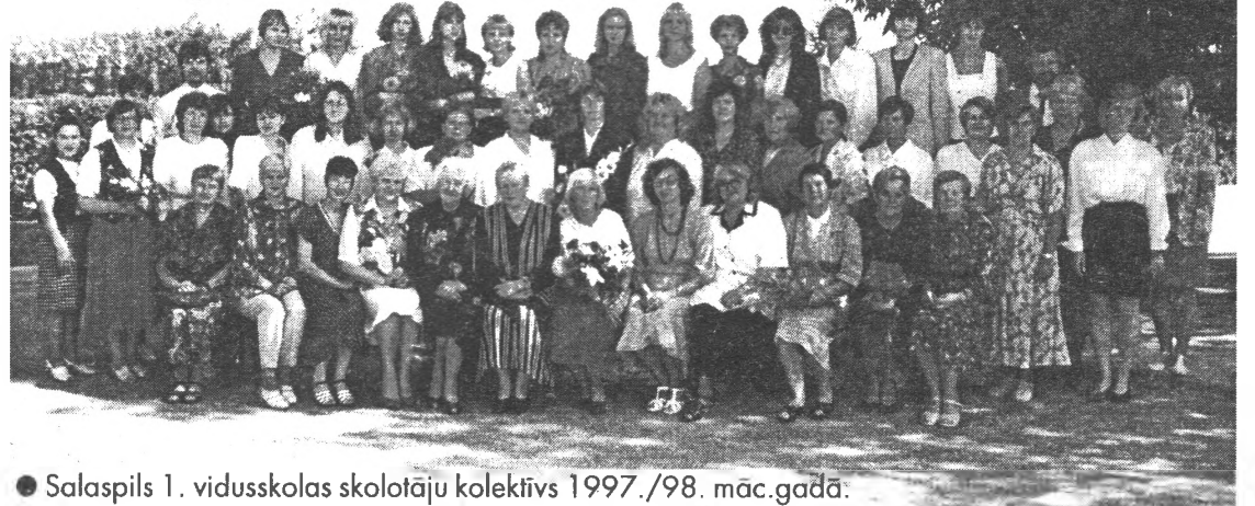
● Salaspils 1. vidusskolas skolotāju kolektīvs 1997./98. māc.gadā.

10. oktobrī uz Salaspils 1. vidusskolas 30 gadu jubilejas svinībām pirmo reizi skolas vēsturē pulcējās tās absolventi un skolotāji. Jubilejas svinības kultūras namā Enerģētīkis un, vēlāk arī skolā, apmeklēja puse no vidusskolas 28 izlaidumu vairāk nekā 800 absolventiem, kā arī 125 skolas bijušie un esošie skolotāji.