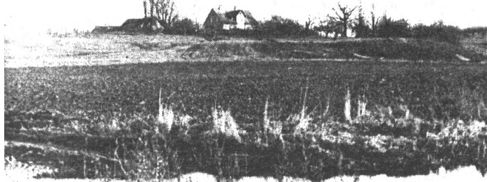
● Kalnaidu mājas pie Spolišu kalna. 1970.-tie gadi

Reti kurš Latvijas apvidus var lepoties ar tik bagātu senvēsturi kā Salaspils apkārtnē. Apdzīvotība šeit konstatēta jau pirms 11 gadu tūkstošiem - to apliecina akmens laikmeta atradumi Salaspils lauk skolā - vecākajā zināmajā apmetnē Latvijā. Arī nākošajos gadu tūkstošos šis Daugavas lejteces apvidus nemitīgi apdzīvots. Vismaz kopš gadsimta Daugavas lejteces ciemos dzīvoja tā dēvētie Daugavas lībieši - Baltijas jūras somu atzars, par kuru savdabīgo un bagāto kultūru stāsta arheoloģiskajos izrakumos atrastās senlietas. Tās var aplūkot tepat netālu, Daugavas muzejā.