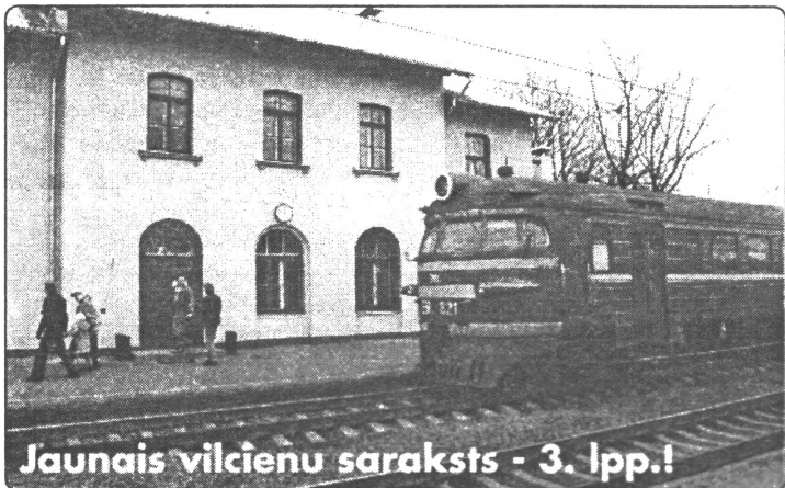
Jaunais vilcienu saraksts - 3. lpp.!